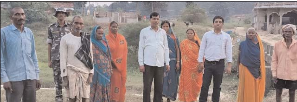
उन्होंने इस सफाई अभियान में बढ़-चढ़कर हिस्सा लेकर पुण्य के भागी बनने की बात कही। सफाई अभियान में

निरीक्षण कर आवश्यक दिशा निर्देश दिया। बीडीओ सह सीओ ने घाट के चारों ओर सफाई कर इसे छठ महापर्व के लिये पूरी तरह तैयार करने की बात कही। साथ ही उन्होंने कचरा हटाने के साथ-साथ पानी की निकासी की भी व्यवस्था करने की बात कही। ताकि घाट पर आने वाले श्रद्धालुओं को किसी प्रकार की परेशानी न हो।