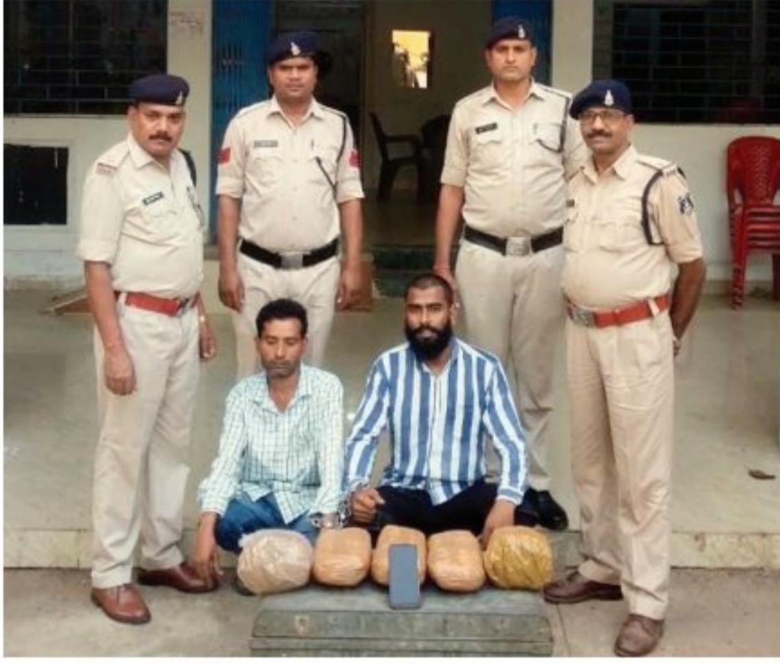
पुलिस टीम द्वारा मुंशी इस्माइल वार्ड भाटापारा में घेराबंदी कर अपने घर के सामने बिक्री करने के लिए अवैध मादक पदार्थ गांजा रखने वाले 02 आरोपियों को

ऑपरेशन विश्वास के तहत थाना भाटापारा शहर पुलिस द्वारा असांजिक तत्वों, अवैध महुआ शराब बनाने वाले, जुआ सट्टा एवं मादक पदार्थ गांजा की तस्करी करने वाले अवैधानिक तत्वों की धरपकड़ कार्यवाही लगातार जारी है। इसी क्रम में मुंशी इस्माइल वार्ड भाटापारा में मादक पदार्थ गांजा की बिक्री करने वाले 01 आरोपी को पकड़ा गया है। मुखबिर सूचना पर *दिनांक 04.11.2024 को थाना भाटापारा शहर