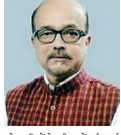
प्रदेशवासियों के जीवन में नई ऊर्जा और उमंग का संचार करे। सूर्य देव की कृपा से सभी का जीवन स्वस्थ, समृद्ध और खुशहाल हो।