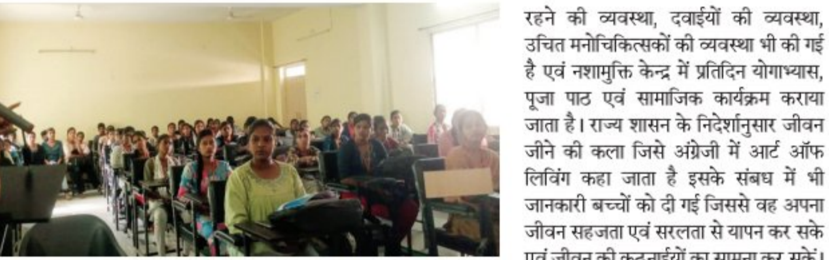
सरकार इन पीडित को नशे के चुंगल से छुड़ाने के लिए नशा मुक्ति अभियान चलाती है, शराब और गुटखें पर रोक लगाने के प्रयास करती है। नशा एक अभिशाप है। यह एक ऐसी बुराई है, जिससे इंसान का अनमोल जीवन समय से पहले ही मौत का शिकार हो जाता है। नशे के लिए समाज में शराब गांजा, भांग, अफिम, जर्दा, गुटखा, तम्बाकू और घुमपान सहित चरस, स्मैक, कोकिन, ब्राउन शुगर जैसे घातक मादक दवाओं और पदार्थों का उपयोग किया जा रहा है। नशे से छुटकारे हेतु नशा मुक्ति केंद्र भी संचालित किया जा रहा है जिसमें