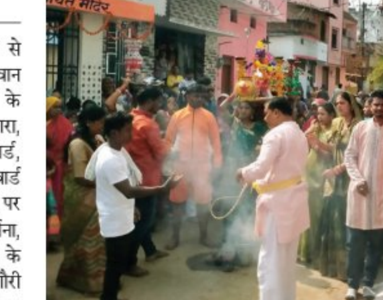
चुलमाटी कार्यक्रम संपन्न किया गया एवं निर्धारित स्थल पर ले जाकर, भगवान गौरा गौरी की मूर्ति संबंधित बैगाओं के द्वारा बनाई गई तथा रात्रि में भगवान गौरा गौरी की विधिवत वैवाहिक कार्यक्रम संपन्न कराई। गोवर्धन पूजा के दिन प्रातः 6 बजे टिकावन