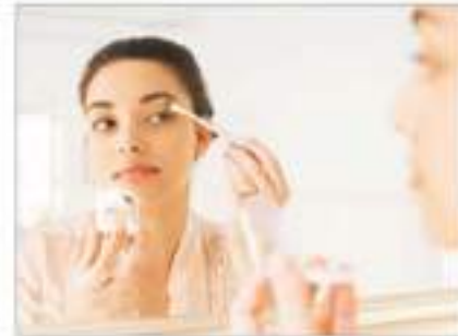
सावधान सुखी और सवेदनशील त्वचा पर सप्ताह में केवल एक बार मुलतानी मिट्टी लगाएं। मुहँसे का भी है विकल्प मुहँसे होने पर इस मिट्टी में सुखी नीम की पत्तियाँ

रूखे-झड़ते बाल और त्वचा में निखार के लिए लोग तरह-तरह के उत्पाद प्रयोग में लाते हैं। इनमें मौजूद रसायन आप पर नकारात्मक असर भी डालते हैं। लेकिन मुलतानी मिट्टी का प्रयोग कर त्वचा में निखार और बालों को घना रखा जा सकता है। कैसे करें बाल काले-घने रूखे बालों को काले-घने करने के लिए एक कप में दो चम्मच नींबू-रस और दो चम्मच शहद एक चौथाई दही में मिलाकर बालों पर लगाएं। इससे बाल मुलायम होंगे। कैसे दूर करें फोड़े-फुंसियाँ फोड़े-फुंसियाँ निकल आने पर मुलतानी मिट्टी में कपूर लगाकर मिलाएं। इससे फोड़े-फुंसियाँ से आपके आज़ादी मिल जाएगी।