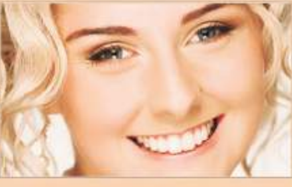
लिए बाँटी आयल, लोशन या क्रीम मॉइश्चराइजिंग ज़ीन अवश्य लगाएं। इससे त्वचा की नमी बरकार रहेगी। -आजकल के मौसम में मुलतानी मिट्टी या ऐसे फेस पैक जो रिकन को ड्राई बनाते हैं, न लगाएं। इसके बदले बलैंगिग फिन्क या ऐसे पैक लगाएं जिनमें ऑयल मौजूद हों। -चेहरे की सफाई के लिए साबुन का प्रयोग करने को बजाय बेसन और दही का प्रयोग कर सकती हैं। इससे

सर्दी के मौसम में थोड़ी सी सावधानी बरतकर आप अपनी त्वचा में निखार ला सकती हैं और इस मौसम का लुप्त उठा सकती हैं यह तो आपने भी महसूस किया होगा कि जाड़े के मौसम में गुनगुनी धूप का आनंद लेना बहुत मुश्किल होता है। सेहत की दृष्टि से भी यह अच्छा होता है, लेकिन यह मौसम त्वचा में रुखपन भी लाता है। अगर आप त्वचा की थोड़ी सी देखभाल कर लें तो यह मौसम आपके लिए आनंददायक हो सकता है। - आजकल के मौसम में गुनगुने पानी से खान करना लाभदायक होता है। यह त्वचा की सफाई करता है और हमारे रोमछिद्रों को खोल देता है। बस यह ध्यान रखें कि पानी बहुत ज्यादा गर्म न हो वनां यह त्वचा की कुदरती नमी को समाप्त कर देगा। यदि संभव हो तो खान करने से पहले नारियल या बादाम या किसी अन्य तेल से शरीर की मालिश करें। इससे त्वचा में निखार आएगा। -खान करने के बाद त्वचा के रूखपन को दूर करने के