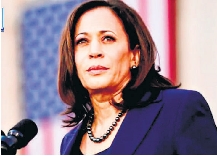
काफी रौबदार थी, जिसके कारण वे स्कूल में सबसे अलग दिखती थीं। कमला हैरिस ने अपने करियर की शुरुआत 1990 में स्टेट बार काउंसिल में असिस्टेंट के रूप में की। 1994 में उनकी मुलाकात 60 वर्षीय विली ब्राउन से हुई, जो तत्कालीन