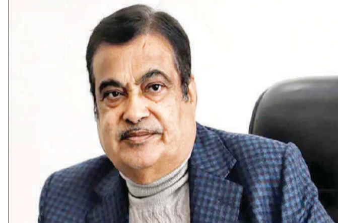
उन्होंने कहा कि कांग्रेस ने 60 सालों में जनता के लिए कुछ नहीं किया और हमेशा

नागपुर (एजेंसी)। केंद्रीय सड़क परिवहन मंत्री नितिन गडकरी ने मुस्लिम महिलाओं की सुरक्षा को लेकर बड़ा बयान दिया है। उन्होंने कहा कि मुस्लिम महिलाओं को भी बिना किसी डर के बाहर निकलना चाहिए और यदि कोई गुंडागर्दी करता है तो उसे सख्ती से निपटने की जरूरत है। गडकरी ने यह टिप्पणी नागपुर के ताज बाग में गुंडागर्दी के खिलाफ चलाए जा रहे अभियान के दौरान की।