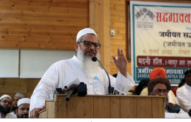
भारत के मुख्य न्यायाधीश की जियो और जियो दो% वाली टिप्पणी पर विचार करते हुए, उन्होंने प्रत्येक भारतीय के लिए एक मार्गदर्शक

लखनऊ (एजेंसी)। जमीयत उलेमा-ए-हिंद के अध्यक्ष मौलाना महमूद मदनी ने उत्तर प्रदेश मदरसा शिक्षा बोर्ड अधिनियम, 2004 पर सुप्रीम कोर्ट के फैसले का स्वागत किया, इसे %न्याय की जीत% और %अंत में बहुत जरूरी रोजनी% बताया। भारतीय मुस्लिम समुदाय के लिए %सुरंग% उन्होंने इस बात पर जोर दिया कि शीर्ष अदालत का फैसला सराहना का पात्र है, उन्होंने कहा कि अक्सर ऐसे फैसले देने के लिए न्यायपालिका, खासकर निचली अदालतों की आलोचना होती है, जो कुछ मामलों में अन्यायपूर्ण लाते हैं। उन्होंने कहा कि सुप्रीम कोर्ट के फैसले का स्वागत किया जाना चाहिए। हमारी अदालतों और खासकर निचली अदालतों के खिलाफ शिकायत है कि उनके फैसले कई मामलों में न्याय के खिलाफ हैं।