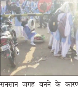
सुनसान जगह बनने के कारण लोग असहज महशूस करते हुए अंडरपास का कड़ा विरोध करते हुए व्यापक आंदोलन छेड़ रखे हैं। विभाग एक तरफ बंद समपार फाटक को खोलने को ठोस कदम नहीं उठा रहा है वहीं दूसरी तरफ ग्रामीण अंडरपास को नकार कर समपार फाटक से आना जाना कर रहे ऐसी हालत में किसी भी समय दुर्घटना घटने का भय बना हुआ है।

प्रातःनागपुरी प्रतिनिधि इटकी। इटकी रेलवे स्टेशन स्थित बंद समपार फाटक से स्कूली छात्र छात्राएं और ग्रामीण धड़ले से आना जाना कर रहे हैं जिससे यहां पर बड़ी दुर्घटना की प्रबल संभावना की स्थिति बन गई है। रांची - लोहरदगा रेलवे मार्ग पर लम्बी दुरी की कई एक्सप्रेस ट्रेन और मालगाड़ी का आवागमन लगातार चालू है फिर भी लोग अंडर पास सड़क को छोड़कर साईकिल सवार और पैदल छात्र छात्राएं जान जोखिम में डालकर समपार फाटक से ही आना जाना कर रहे हैं। ऐसी परिस्थिति में कभी यहां पर दुर्घटना घट सकती है। बता दें रेलवे विभाग ने लोगों के आवागमन के लिए करोड़ों की लागत अंडर पास रोड़ निर्माण कर पिछले दिन समपार फाटक को बंद कर रखा है किन्तु अंडर पास