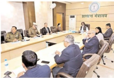
प्रधानमंत्री प्लान तैयार कर चिह्नित अपराधों पर कड़ी कार्यवाही सुनिश्चित करे. ऑनलाइन ड्राइंग तभी खेला जब तक पुलिस का इ-अपराधों के भीतर

मुंबई (एनडी): मुख्यमंत्री हेमंत सोरेन ने प्रोजेक्ट भवन स्थित शाहूद न्यायालय में मंगलवार को अधिकारियों के साथ उच्चस्तरीय बैठक की. उन्होंने राज्य में विधि व्यवस्था सुदृढ़ करने, अपराध पर नियंत्रण, अवैध माइनिंग पर रोक, नशा के धंधेबाजों पर नकेल कमाने व साइबर अपराध पर लगाम लगाने का निर्देश दिया. कहा कि अवैध माइनिंग पर हर हाल में रोक लगाएं, बैठक में पुलिस विभाग के अधिकारियों ने मुख्यमंत्री के संसद पार पॉइंट प्रेजेंटेशन (पीपीटी) के माध्यम से विधि व्यवस्था, अवैध माइनिंग पर रोक समेत विभिन्न प्रकार के अपराध नियंत्रण के लिए की गई कार्यवाही की विस्तृत जानकारी रखी. सीएम ने कहा कि राज्य में बेहतर विधि व्यवस्था बनाना सरकार की सर्वोच्च प्राथमिकता है. सुनिश्चित अपराध को रोकने के लिए पुलिस