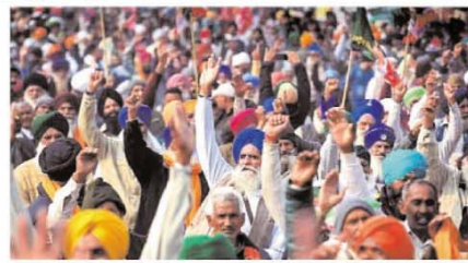
मुआवजा दिलाने, फसल बीमा, जमीन कर्ज में सहायता, भूमिहीन किसानों के लिए रोजगार, मुआवजे का उचित भुगतान आदि के दाये बढ़-चढ़ कर करती हैं, मगर हकीकत नहीं है

पहले भी कई बार वे दिल्ली की तरफ बढ़ने का प्रयास कर चुके हैं। उत्तर प्रदेश सरकार पर दबाव बनाने की कोशिश करते रहे हैं। मगर उनकी मांगों पर टीक से विचार नहीं किया गया। दरअसल, अलग-अलग सरकारों के समय अलग-अलग मुआवजा नीति के तहत नोएडा के किसानों से लगू गई जमीन का भुगतान किया गया। उनमें बहुत सारे किसानों को अंततः मुआवजा नहीं मिला था, जिससे लेकर वे आंदोलन करते रहे।