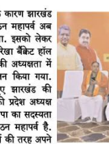
भाजपा यह संगठन महापर्व अन्य पक्षों की तरह अपने विशाल परिवार के साथ मनाती है.