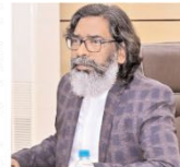
चार साल से सूचना आयोग की नियुक्ति नहीं

रांची (एजेंसी) : हेमंत मंत्रिमंडल के गठन होने के बाद से ही बोर्ड-निगम व आयोग के लिए लॉबिंग शुरू हो गयी है। कई हेवीवेट नेता बोर्ड-निगम में अध्यक्ष की कुर्सी के लिए जोरदार आग्रह कर रहे हैं। खास कर जेएसएमडीसी के अध्यक्ष के लिए, जेडा और टीवीएनएल पर भी कई हेवीवेट नेताओं की नजर है। फिलहाल राज्य में कई ऐसे बोर्ड निगम व आयोग हैं, जो प्रभार में चल रहे हैं। जेएसएमडीसी (झारखंड स्टेट मिनेरल डेवलपमेंट कॉर्पोरेशन लिमिटेड), टीवीएनएल (तेलुगु टेलुगु विद्युत निगम लिमिटेड) के अलावा झारखंड राज्य कर्मचारी चयन आयोग (जेएससीसी), झारखंड फिनान्स डेवलपमेंट कॉर्पोरेशन लिमिटेड (जेएफडीसीएल), झारखंड राज्य प्रमुख निगम बोर्ड (जेएसपीसीबी), झारखंड राज्य आयोग (जेएसआर) आदि प्रभार में चल रहे हैं।