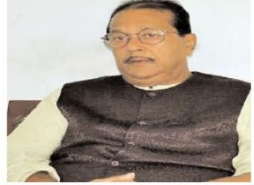
योजना नहीं बनाई गई है. कृषि उत्पादन बढ़ाने या कृषि-संबंध उद्योगों को बढ़ावा देने की दृष्टि का अभाव था, जो झारखंड में ८० फीसदी आबादी को संतुष्ट बना सके. पिछली सरकारों ने अस्पताल बनाने तो बावजूद लेकिन उच्च-संवाहक करने के लिए आवश्यक मानव संसाधन उपलब्ध करने में विफल रहें. ग्रामीण उत्पादकों में कोई डॉक्टर, नर्स या दवाएं उपलब्ध नहीं हैं.