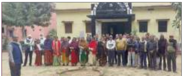
लोकतंत्र की आवाज