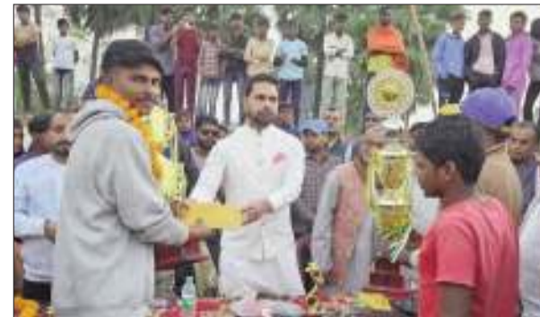
लोक तंत्र की आवाज