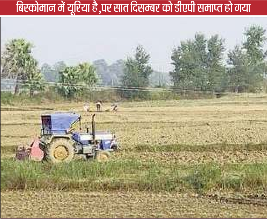
बिस्कोमान में यूरिया है, पर सात दिसम्बर को डीएपी समाप्त हो गया

वारिसलीगंज (नवादा) (अभय कुमार रंजन)। जिले में धान का कटोरा के रूप में अपनी पहचान रखने वाले वारिसलीगंज क्षेत्र के किसान अपने खेतों में बड़े पैमाने पर धान के बाद गेहूं की खेती करते हैं। जिसके लिए बुआई के समय यूरिया के साथ-साथ डीएपी की मांग बढ़ जाती है। पिछले चार दिनों से बिस्कोमान में डीएपी उपलब्ध नहीं है। जिस कारण किसान बाजार से महंगी डीएपी खरीदने को विवश हो रहे हैं। क्षेत्र के सभी खेतों में कोई वैकल्पिक खेती नहीं होने के कारण किसान सभी खेतों में गेहूं की फसल लगाते हैं। जिसके लिए किसानों को कम से कम पांच हजार बैग डीएपी उर्वरक की आवश्यकता है। लेकिन सरकार द्वारा संचालित बिस्कोमान में कम डीएपी उपलब्ध कराई जाती है। जिस कारण बुआई के समय उर्वरक की किल्लत हो जाती है। अधिकारियों से मिली जानकारी के अनुसार अभी तक बिस्कोमान में मात्र 1500 बैग डीएपी एवं पीपीएस उर्वरक उपलब्ध हो पाई है। बता दें कि पिछले कुछ वर्षों से धान और गेहूं की बुआई के समय उर्वरक की भारी किल्लत हुआ करती थी। जिस कारण परेशान किसानों द्वारा सड़क जाम और आंदोलन भी किया जा चुका है। लेकिन इस वर्ष गेहूं की बुआई के समय यूरिया के साथ-साथ कम मात्रा में डीएपी बिस्कोमान में उपलब्ध रहा। लेकिन पिछले चार दिनों से डीएपी नहीं है। अब जबकि खेतों से लगभग धान की कटनी हो चुकी है। तब किसान बड़े पैमाने पर गेहूं की बुआई करने में जुट गए हैं। लेकिन बिस्कोमान