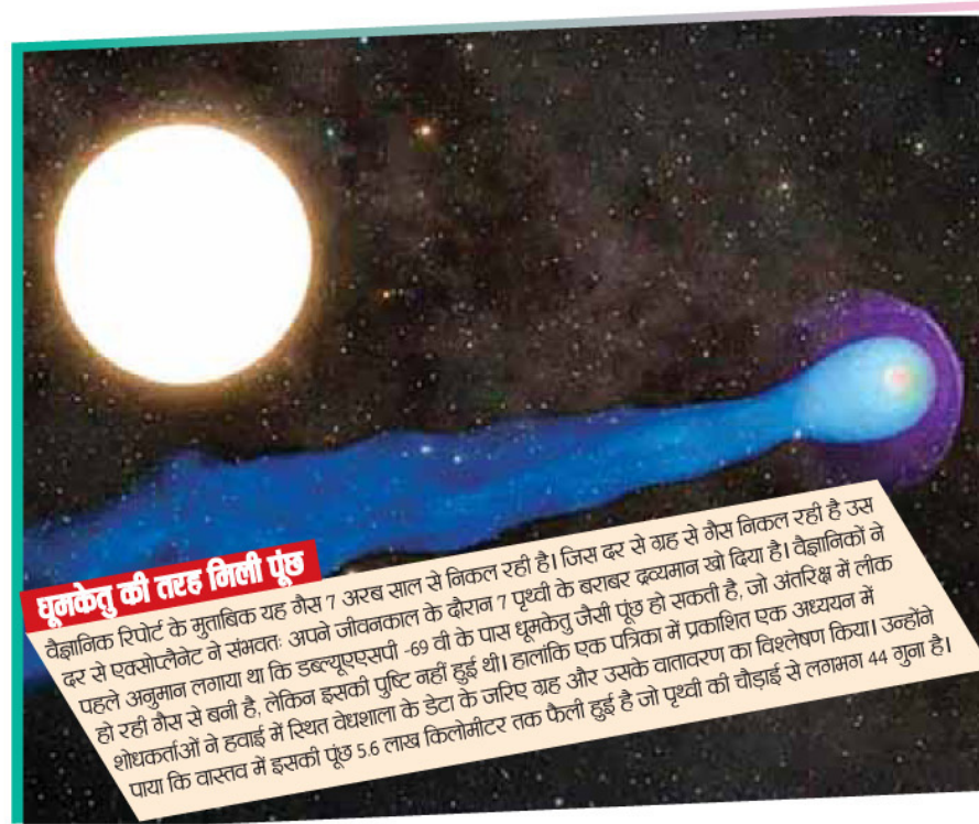
वैज्ञानिक रिपोर्ट के मुताबिक यह गैस 7 अरब साल से निकल रही है। जिस दर से गैस निकल रही है उस दर से एक्सोप्लैनेट ने संभवतः अपने जीवनकाल के दौरान 7 पृथ्वी के बराबर द्रव्यमान खो दिया है। वैज्ञानिकों ने इस ग्रह से एक्सोप्लैनेट के नाम डब्ल्यूएसपी-69 वी के पास धूमकेतु जैसी पूछ हो सकती है, जो अंतरिक्ष में लीक होने से एक्सोप्लैनेट बनाया था कि डब्ल्यूएसपी-69 वी की पूछ नहीं हुई थी। हालांकि एक पत्रिका में प्रकाशित एक अध्ययन में पहले अनुमान लगाया था कि डब्ल्यूएसपी-69 वी की पूछ तब बनती है जब तारकीय हवाएं लीक हो रही गैस को यह से दूर धकेल देती हैं, जिससे उसके पीछे एक निशान बन जाता है। तारकीय हवाएं हमारे सूर्य से निकलने वाली और हवाओं के समान हैं। अगर तारकीय हवाएं गायब हो जाएं तो पूछ भी खत्म हो जाएगी।