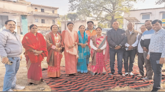
कुलवीर सिंह @झारखंड उजाला संवाददाता

सिंदरी/बलियापुर /धनबाद: प्लस 2 उच्च विद्यालय बलियापुर के प्रांगण में बृहद झारखंड कला संस्कृति मंच की एक बैठक हुई। बैठक में उपस्थित सदस्यों ने निर्णय लिया कि दिनांक 31 दिसंबर को मंच की ओर से डहरे टुसू का आयोजन किया जाना है, उसमें ज्यादा से ज्यादा लोगों की भागीदारी हो। साथ ही टुसू, चौड़ल के साथ साथ सांस्कृतिक दल झूमर, नटवा आदि की झांकी भी