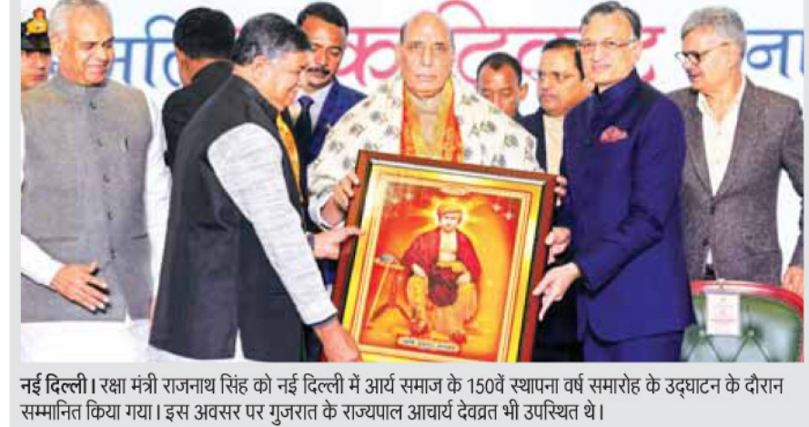
नई दिल्ली। रक्षा मंत्री राजनाथ सिंह को नई दिल्ली में आर्य समाज के 150वें स्थापना वर्ष समारोह के उद्घाटन के दौरान सम्मानित किया गया। इस अवसर पर गुजरात के राज्यपाल आचार्य देवव्रत भी उपस्थित थे।