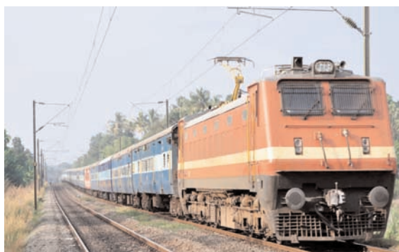
मेला स्पेशल ट्रेनें की 06 जोड़ी ट्रेनें और टंडुला, हावड़ा और भिंड के बीच चलेगी।

संताल एक्सप्रेस संवाददाता देवघर/जसीडीह। महाकुंभ मेला 12 साल में एक बार होने वाला खगोलीय आयोजन है, जो दुनिया भर के लाखों श्रद्धालुओं के लिए आध्यात्मिक और सांस्कृतिक रूप से बहुत महत्वपूर्ण है। इस पृथ्वी पर सबसे बड़े मानव समामग के रूप में पहचाने जाने वाले महाकुंभ के आस्था, भक्ति और परंपरा का उत्सव माना जाता है। इस भव्य आध्यात्मिक समामग में आने वाले श्रद्धालुओं की भारी भीड़ को ध्यान में रखते हुए और निर्वाह यात्रा सुनिश्चित करने के लिए रेलवे कुंभ