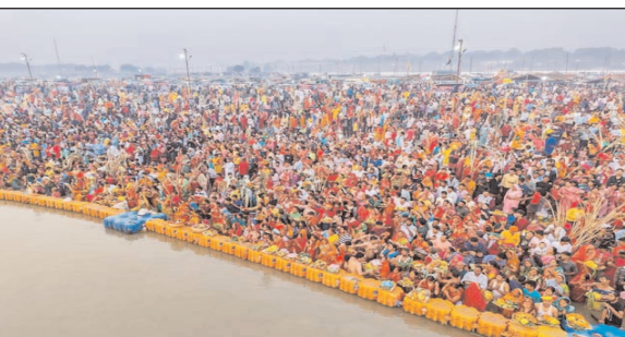
मेनाक सार्वजनिक टाण्डीते ओड़कू रेयाक् जिओ टैगिंगकामे दो एहोप् आकाना। डिल्टा टोय रे नित 700 गोटेच् खोनजासती सार्वजनिक टाण्डीते ओड़कू मेनाक आकादा। नोआ साफ-साफरेयाक् जिम्माबारी दो

वाराणसी। महाकुंभ 2025 रे भोक्तो दो प्रयागराज तायोम वाराणसीतेको सेटेरोक् आ। भोक्तोकोवाक् जोतो खोन माराडपुसकिलालाक् दो साभ-साभि दो ओड़कू बाड जामोक् गे काना। सोड़क रे पाड़क वाला सार्वजनिक टाण्डीते ओड़कू रेयाक्किना बाइय ठेक दो आडी मुसकिल लेकते काना। वाराणसी जिलाप्रशासन दो भोक्तोकोवाक् नोआ मुसकिलालाक् फाड़व ताको लागि्त प्रयागराज खोन वाराणसी रेयाक् जोतो डहर रे सार्वजनिक टाण्डीते ओड़कू रेयाक् जिओ टैगिंग एहोप् आकादा। मुख्य विकास अधिकारी दोय लाई केदा जे नगर निगम होतेते डिल्टाटोय रे