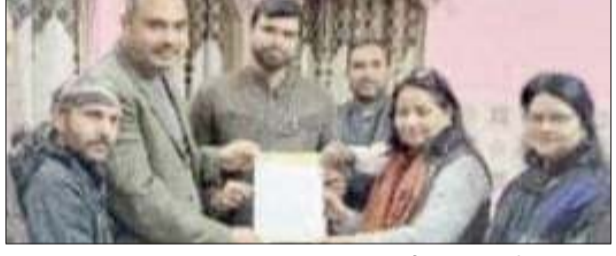
लोकतंत्र की आवाज