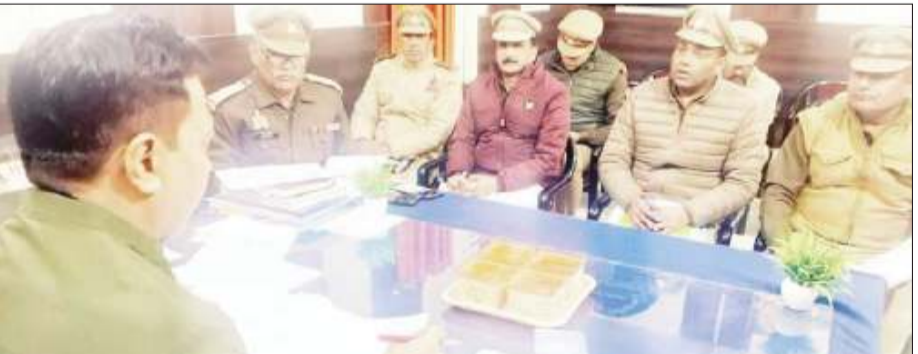
लोकतंत्र की आवाज