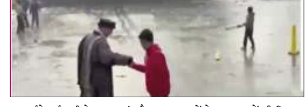
लोकतंत्र की आवाज

रिपोट जसवीर सिंह उत्तराखंड में भी बर्फ जमने लगी है बताया जा रहा है की मध्य प्रदेश जम्मू-कश्मीर, हिमाचल प्रदेश और उत्तराखंड में लगातार हो रही बर्फबारी के कारण कई सड़कें बंद हैं। हिमाचल में 2 हाइवे समेत 24 सड़कों पर लगातार तीसरे दिन बसों की आवा जाही बंद है। नेशनल हाइवे 305 पर भी करीब 1 फुट बर्फ है। प्रशासन बर्फ हटाने की कोशिश में जुटा हुआ है। उत्तराखंड में भी जोशीमठ और पिथौरागढ़ में बर्फबारी के कारण नेशनल हाइवे और स्टेट हाइवे बंद है। देहरादून में भी त्यूनी-चक्रता-मसूरी नेशनल हाइवे के 30 किलोमीटर स्ट्रेच