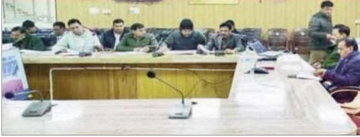
लोकतंत्र की आवाज

अधिशासी अभियंता लोनिवि के विरुद्ध चेतावनी जारी करने के निर्देश भी दिए