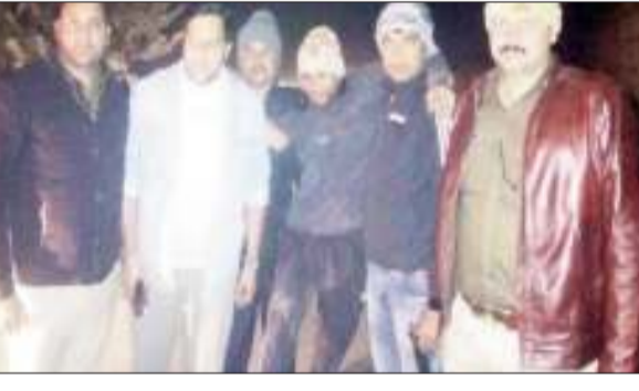
लोकतंत्र की आवाज

रिपोट मुकेश सिंह शामली। शहर कोतवाली पुलिस, आदर्श मंडी एवं एसओजी टीम में गौकशी घटना में शामिल 25 हजार के इनामी एक गौतस्कर सहित दो गौतस्करों को मुठभेड़ के बाद गिरफ्तार कर लिया। पुलिस ने गौतस्करों के कब्जे से दो तमंचे व एक बाइक भी बरामद की है। गौकशी के मामले में पुलिस सात गौतस्करों को पूर्व जेल भेज चुकी है। में ही जानकारी के अनुसार 27 जुलाई को क्षेत्र के गांव झाल के जंगल में प्रतिबंधित पशु के अवशेष मिलने के बाद ग्रामीणों में आक्रोश फैल गया था। मौके पर पहुंची पुलिस ने अवशेषों को दफनाने के साथ ही इस संबंध में गौतस्करों के खिलाफ मुकदमा करते हुए सात आरोपितों को गिरफ्तार कर जेल भेज दिया था जिनके अन्य फ़ार चल रहे थे। एसपी ने भी आरोपितों की धरपकड़ के लिए कोतवाली पुलिस, आदर्श मंडी एवं