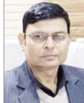
लोकतंत्र की आवाज

मौके पर जाकर की गई। जिसमें नगर क्षेत्र के जगजीवनपुर हट्टी, तकीपुर तुलसी, नूरसराय, निजाम सराय, कस्बा नगीना, चतर भोजपुर, कुशाल, पुर सादिक, औरंगजेबपुर मोहन, मोहम्मद हुसैनपुर पृथ्वी, औरंगजेबपुर लाल, मोहल्ला शहलीपुर रामचंद्र, रसोदपुर सतीदास, मीरापुर चक्रवर्ती, औरंगजेबपुर हरदास, अशरफपुर राधो, कस्बा वाजिया फत, कस्बा कोटरा आदि चक सभी 16 तालाबों की भूमि की जांच क्षेत्रफल की नपाई कराकर की। उन्होंने कहा कि तालाबों की भूमि पर किए गए अवैध कब्जे हटवाकर तालाबों की भूमि को कब्जा मुक्त कराने का कार्य शीघ्र किया