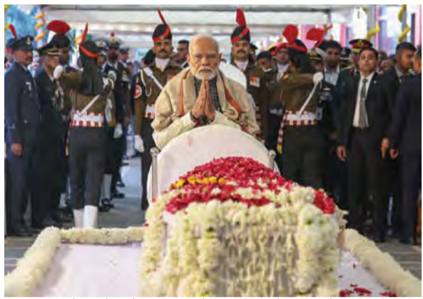
प्रधानमंत्री नरेन्द्र मोदी ने शनिवार को नई दिल्ली के निगमबोध घाट श्मशान घाट पर पूर्व प्रधानमंत्री मनमोहन सिंह को अंतिम श्रद्धांजलि अर्पित की।

डॉ. सिंह के अंतिम संस्कार में राष्ट्रपति द्रौपदी मुर्मु, उपराष्ट्रपति जगदीप धनखड़, प्रधानमंत्री नरेन्द्र मोदी, लोकसभा अध्यक्ष ओम बेरला, भूटान नरेश जिग्मे खेसर त्ग्यायेल वांगचुक, गुहमंत्री अमित शाह, रक्षा मंत्री राजनाथ सिंह, संसदीय कार्यमंत्री किरेन रिजिजू, गजपा अध्यक्ष तथा केंद्रीय मंत्री जेपी नड्डा, दिल्ली की मुख्यमंत्री प्रीतिश्री, कांग्रेस अध्यक्ष ललितकार्जुन खरगे, कांग्रेस संसदीय दल की नेता सोनिया