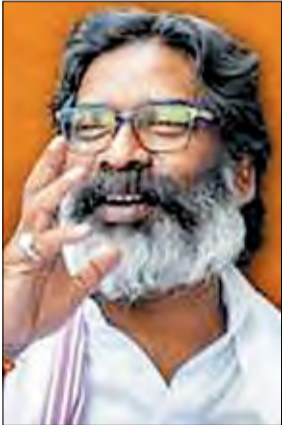
2500 रुपए डाल दिये गये। झारखंड में मईयां सम्मान योजना

को लेकर विपक्ष की ओर से उठाये जा रहे तमाम तरह के सवालों के बीच हेमंत सरकार ने महिलाओं के खाते में इस योजना की पांचवी किस्त भेजनी शुरू कर दी है। सीएम हेमंत ने अपने मैसज में कहा, मैंने जो वादा राज्य की महान जनता से किया था, उसे पूरा कर रहा हूँ। हर मईयां के खाते में हर माह 2500 रुपये दिये जा रहे हैं। साल में पूरे 30 हजार रुपये मिलेंगे। अफसरों को निर्देश : हेमंत सोरेन सरकार ने अधिकारियों को ये भी निर्देश दिये हैं कि जो भी इस योजना के लिए हकदार नहीं हैं उन्हें चिन्हित कर उनका रजिस्ट्रेशन खारिज किया जाये। इसके बाद अधिकारियों ने इस पर कार्रवाई भी शुरू कर दी है। सीएम हेमंत सोरेन 28 दिसंबर को होने वाले कार्यक्रम में खुद लाभुकों को राशि देने की घोषणा करने वाले थे लेकिन कार्यक्रम के रद्द होने के कारण, लाभार्थियों के खाते में पहले ही राशि क्रेडिट होनी शुरू हो गयी। झामुमो ने अपने घोषणा पत्र में कहा था कि सरकार बनते ही मईयां सम्मान योजना की राशि को 1000 से बढ़ाकर 2500 रुपये कर दिया जायेगा। घोषणा के अनुसार सरकार अपना वादा पूरा कर रही है।