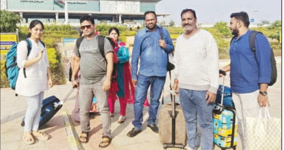
होगी। देवघर से मायानगरी की यात्रा महज दो घंटा 40 मिनट में पूरी होगी। मुंबई से यह विमान दोपहर एक बजे देवघर लैंड करेगी और दोपहर 1:30 बजे टेकआफ करेगी। भारत की वित्तीय राजधानी मुंबई और प्रमुख आध्यात्मिक स्थल देवघर के बीच निर्बाध संपर्क प्रदान

संताल एक्सप्रेस संवाददाता देवघर। मंगलवार को दोपहर एक बजे मुंबई से इंडिगो की फ्लाइट देवघर एयरपोर्ट पहुंची। जहां वाटर केसन सैल्यूट से स्वागत किया गया। इससे पहले दिल्ली से ऑनलाइन नागरिक उड्डयन मंत्री राम नायडू के साथ गोड्डा सांसद निशिकांत दुबे ने हरी झंडी दिखाकर मुंबई से देवघर के लिए फ्लाइट को रवाना किया। 164 यात्रियों को लेकर पहली पलाइट मुंबई से देवघर पहुंची। देवघर पहुंचने पर लोगों ने बाबा बैद्यनाथ की धरती को नमन किया और कहा कि प्रधानमंत्री नरेंद्र मोदी के कारण यह संभव हो पाया है। बता दें कि देवघर से मुंबई उड़ान सेवा सप्ताह में तीन दिन मंगलवार, गुरुवार और शनिवार को उपलब्ध