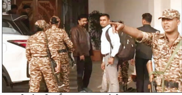
प्रदान की गई। कथित तौर पर, इस मामले में पैसे के बदले फर्जी प्रमाण जमा किए गए और मेडिकल कॉलेजों में प्रवेश दिए गए। इस साल सितंबर में सुप्रीम कोर्ट के मुख्य न्यायाधीश ने इस मामले पर चिंता जताई थी। सूत्रों ने बताया कि ईडी ने बिधाननगर सिटी पुलिस के तहत इलेक्ट्रॉनिक कॉम्प्लेक्स पुलिस स्टेशन द्वारा दर्ज की गई शिकायत के आधार पर जांच शुरू की थी।

एजेंसी कोलकाता। निजी मेडिकल कॉलेजों फर्जी दस्तावेजों के आधार पर एडमिशन और कथित भ्रष्टाचार को लेकर प्रवर्तन निदेशालय (ईडी) ने मंगलवार को पूर्वी मेदिनीपुर के हल्दिया में मेडिकल कॉलेज एडमिशन कोटा भ्रष्टाचार मामले में तलाशी अभियान चलाया। ईडी हल्दिया, दुर्गापुर और कोलकाता समेत राज्य के कई निजी मेडिकल कॉलेजों पर छापेमारी कर रही है। पूरे देश में 28 जगहों पर एमबीबीएस एडमिशन में कोटा भ्रष्टाचार की खबरें आई हैं। प्रत्येक छापेमारी दल को केंद्रीय सशस्त्र पुलिस बल (सीपीएल) के जवानों द्वारा सुरक्षा