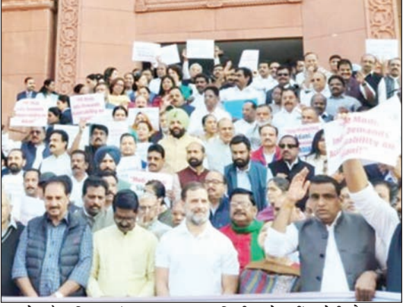
चलाने के लिए संसद चलना आवश्यक है। संसद की कार्यवाही यदि ठीक से नहीं चलेगी तो उसका सबसे ज्यादा असर देश पर दिखेगा।

एजेंसी नई दिल्ली। संसद के शीतकालीन सत्र के 6वें दिन मंगलवार को विपक्ष के सदस्यों ने अडानी और संभल हिंसा मामले को लेकर जबरदस्त प्रदर्शन किया है। सदन शुरू होने से पहले विपक्षी इंडिया ब्लॉक के नेताओं ने सरकार के खिलाफ प्रदर्शन करते हुए पोस्टर दिखाए। विरोध प्रदर्शन में लोकसभा में नेता प्रतिपक्ष राहुल गांधी, कांग्रेस सांसद प्रियंका गांधी भी शामिल हुए। इसमें सपा और टीएमसी सदस्य शामिल नहीं हुए। विपक्ष के प्रदर्शन और नारेबाजी के दौरान केंद्रीय संसदीय कार्यमंत्री किरन रिजजू ने कहा, कि देश