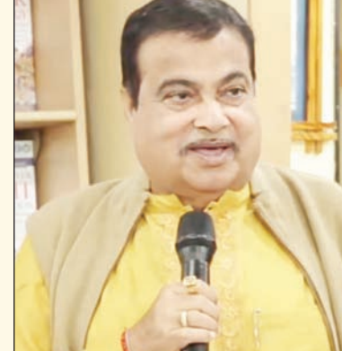
क्योंकि उसे मंत्री पद नहीं मिल सका। भाजपा नेता ने कहा, जो मंत्री बनता है वह इसलिए दुखी रहता है कि उसे अच्छा मंत्रालय नहीं मिला और वह मुख्यमंत्री नहीं बन पाया तथा मुख्यमंत्री इसलिए तनाव में रहता है क्योंकि उसे नहीं पता कि कब आलाकमान उसे पद छोड़ने के लिए कह देगा। उन्होंने कहा कि जीवन में समस्याएं बड़ी चुनौतियां पेश करती हैं और उनका सामना करना तथा आगे बढ़ना ही जीवन

एजेंसी नागपुर। केंद्रीय मंत्री नितिन गडकरी ने मुख्यमंत्री के पद और राजनैतिक संतुष्टि को लेकर बड़ा बयान दिया है। यहां आयोजित एक पुस्तक के विमोचन समारोह में उन्होंने कहा कि मुख्यमंत्री हमेशा ही डरा और सहमा रहता है। उसके भीतर डर बना रहता है कि न जाने कब हाईकमान उसकी छुट्टी कर दे। जहां तक राजनीति का सवाल है तो यहां कोई भी संतुष्ट नहीं होता है। गडकरी ने कहा है कि राजनीति असंतुष्ट आत्माओं का सागर है, जहां हर व्यक्ति दुखी है और अपने वर्तमान पद से ऊंचे पद की आकांक्षा रखता है। नागपुर में जीवन के 50 स्वर्णिम नियम नामक पुस्तक के विमोचन के अवसर पर गडकरी ने कहा कि जीवन समझौते, बाध्यताओं, सीमाओं और विरोधाभासों का खेल है। मंत्री ने राजस्थान में आयोजित एक कार्यक्रम को याद करते हुए कहा कि राजनीति असंतुष्ट आत्माओं का सागर है, जहां हर व्यक्ति दुखी है... जो पार्षद बनता है वह इसलिए दुखी होता है क्योंकि उसे विधायक बनने का मौका नहीं मिला और विधायक इसलिए दुखी होता है