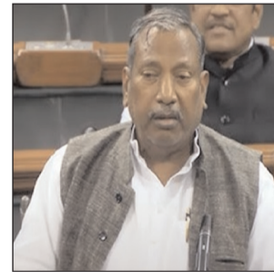
दिसा में मंजूरी देने का काम करें। साथ ही स्टेशन के भवनों का डिजाईन स्थानीय संस्कृति, ऐतिहासिक विरासत और वास्तुकला के आधार पर ही तय किया जाये। राजगीर ब्रह्मा जी की पवित्र यज्ञ-भूमि संस्कृति और वैभव का केन्द्र होने के साथ-साथ देवनगरी

राजगीर जैन, बौद्ध और हिन्दू धर्मावलंबियों की संगम-स्थली एवं तीर्थ-स्थली है। राजगीर का ऐतिहासिक और पुरातात्विक महत्व है। धार्मिक मान्यताओं के अनुसार प्रत्येक तीन वर्षों में एक माह मलमास में सभी देवी-देवताओं का वास राजगीर में होता है। यहाँ मलमास में विश्व-प्रसिद्ध विराट मलमास मेला लगता है।