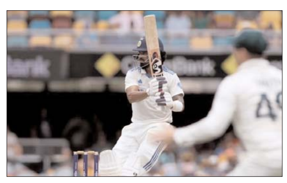
चलते स्टार्क का दूसरा शिकार बने। विराट कोहली एक बार फिर

उसे फॉलोआन बचाने के लिए अभी भी 70 रनों से ज्यादा की जरूरत है। ऑस्ट्रेलिया ने अपनी पहली पारी में 445 रन बनाए थे। बारिश के व्यवधान के बीच भारत की पहली पारी की शुरुआत खराब रही और मिचेल स्टार्क ने पारी की दूसरी ही गेंद पर यशस्वी जायसवाल (04) चलता कर भारत को पहला झटका दिया। शुभमन गिल भी कुछ खास नहीं कर सके और केवल 1 रन बनाकर