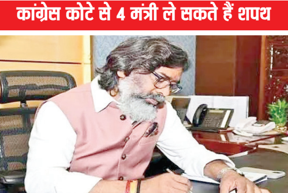
कांग्रेस कोटे से 4 मंत्री ले सकते हैं शपथ