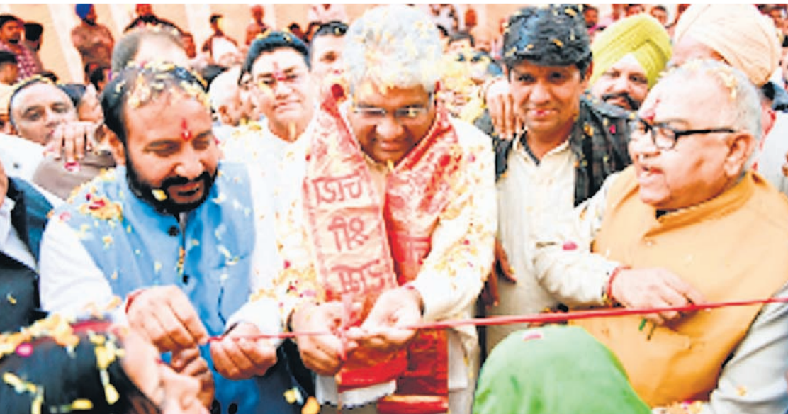
केंद्र खोला है। रामगढ़ में भारतीय जनता पार्टी का हर कार्यकर्ता एक टीम के रूप में विकास के लिए कार्य करेगा। भूपेंद्र यादव ने कहा कि कहा कि संसद में संधिधान के 75 साल पूरा होने पर चर्चा चल रही है। लोकसभा की इस चर्चा में प्रधानमंत्री नरेंद्र

केंद्रीय वन पर्यावरण एवं जलवायु परिवर्तन मंत्री भूपेंद्र यादव रविवार को अलवर जिले के रामगढ़ विधानसभा क्षेत्र पहुंचे और नवनिर्वाचित विधायक सुखवंत सिंह के साथ जनसेवा केंद्र कार्यालय का उदघाटन किया। इस अवसर पर भूपेंद्र यादव ने कहा कि यह सौभाग्य का क्षण है कि राजस्थान में मुख्यमंत्री भजनलाल के नेतृत्व में भारतीय जनता पार्टी की सरकार को 1 वर्ष पूरा हो गया है। इसे एक वर्ष में राजस्थान में विकास के अनेक कार्य हुए हैं, राजस्थान में परिवर्तन नजर आ रहा है और यह परिवर्तन रामगढ़ में भी नजर आ रहा है। भूपेंद्र यादव ने कहा, रउपचुनाव में विजयी होने के बाद उन्होंने सुखवंत सिंह से कहा कि विधायक और सांसदों को लगातार अपने क्षेत्र में लोगों के बीच में रहना चाहिए, लोग कहाँ मिले उनके लिए एक निश्चित जगह होनी चाहिए। मुझे खुशी है कि मेरे साथी के रूप में उन्होंने रामगढ़ में आप लोगों की समझाओं के लिए, समाधान के लिए, विकास के लिए जनसेवा