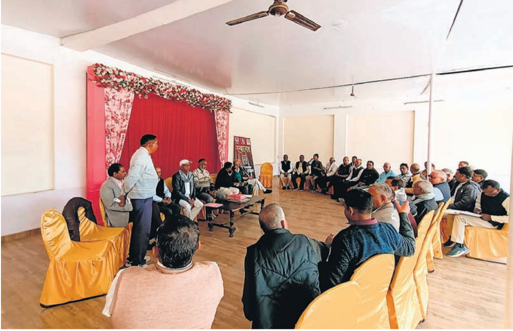
जलदबाजी में लिया गया निर्णय बताते हुए निलम्बन को निरस्त करने की मांग की। बैठक में दिनांक 22 दिसम्बर 2024 राजस्थान मेघवाल समाज की प्रदेश को जयपुर में आयोजित हो रही स्तरीय बैठक में भाग लेने का भी निर्णय