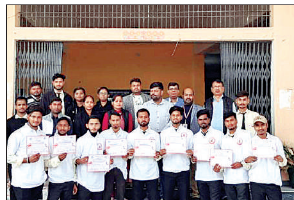
प्रमाण पत्र के साथ रक्तदाता