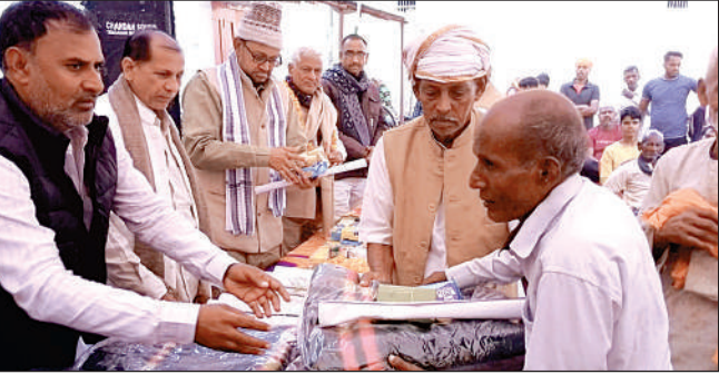
जरूरतमंदों को कंबल देते अतिथि गण।