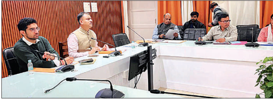
राइफल क्लब में बैठक करते डीएम एस राजलिंगम

राइफल क्लब में जिला स्तरीय स्कूल सुरक्षा समन्वय समिति की बैठक की। जिलाधिकारी एस राजलिंगम ने जनपद में सड़को के आसपास स्थित स्कूलों की सूची तैयार कर जांच करने का निर्देश दिया। जिन स्कूलों के भवनों का नया निर्माण किया गया है या