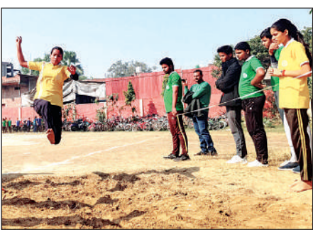
मुंगराबादशाहपुर के सिटी पब्लिक स्कूल में खेलकूद प्रतियोगिता लम्बी कूद लगाती प्रतिभागी।