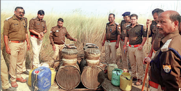
बरामद लहने को नष्ट करती पुलिस।

मनियर (बलिया)। थाना क्षेत्र के दियारा टुकड़ा न -2 में आबकारी विभाग बलिया की टीम ने बुधवार 4 दिसंबर को बड़ी कार्यवाही की जिसमें करीब 120 लीटर अवैध कच्ची शराब बरामद किया गया तथा करीब 2500 लीटर लहने को नष्ट किया गया तथा शराब बनाने वाली भड़ियों को तोड़ा गया। आबकारी की टीम ने बताया कि संयुक्त आबकारी आयुक्त, गोरखपुर जोन, उप आबकारी आयुक्त आजमगढ़ प्रभार के निदेशानुसार एवं जिला आबकारी अधिकारी बलिया, सहायक