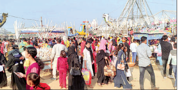
ददरी मेले में उमड़ी भीड़।