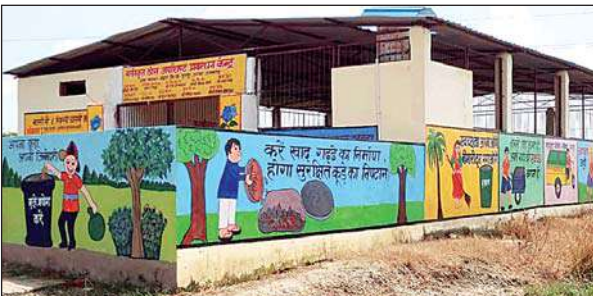
एक गांव में बना तरल अपशिष्ट प्रबंधन केंद्र।

फूलपुर (आजमगढ़)। सरकार द्वारा ग्राम पंचायतों को माॅडल गांव के रूप में विकसित करने के लिए तमाम योजनाएं संचालित की जा रही हैं। इसके बाद भी फूलपुर ब्लॉक की ग्राम पंचायतें माॅडल गांव के रूप में विकसित नहीं हो सकीं। गांवों में कूड़ा-कचरा, खुली नाली, पक्की नाली, सोखा गद्दा बनाकर गांव को स्वच्छ बनाने का लक्ष्य था। इसके लिए टोस एवं तरल अपशिष्ट प्रबंधन योजना की शुरुआत की गयी थी। जिसे एएसएलडब्ल्यूका का नाम दिया गया। ग्रामीण परिवेश में माॅडल गांव का नाम दिया गया था। इसके तहत जिले के ब्लॉकों के कुल गांव का चयन कर कार्य प्रारंभ कराया गए। फूलपुर ब्लॉक के 58 ग्राम पंचायतों का चयन वर्ष 2023-24 में किया गया। प्रत्येक चयनित ग्राम पंचायत में फिल्टर चेम्बर, खाद गद्दा, वैज्वै कैंचर, शोल्ड कैचर, सोक पिट, डब्ल्यू एसपी बनना था।