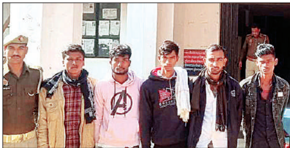
पुलिस गिरफ्तार के आरोपी

बराहमदगी के बाद युपी की तरफ से दी गई तहरीर पर मामले में धारा 351(2), 333, 70(1) बीएनएस के तहत केस दर्ज किया गया। पुलिस का कहना है बराहमदगी के बाद युवतियों द्वारा बताया गया कि रात्रि में उसको घर से