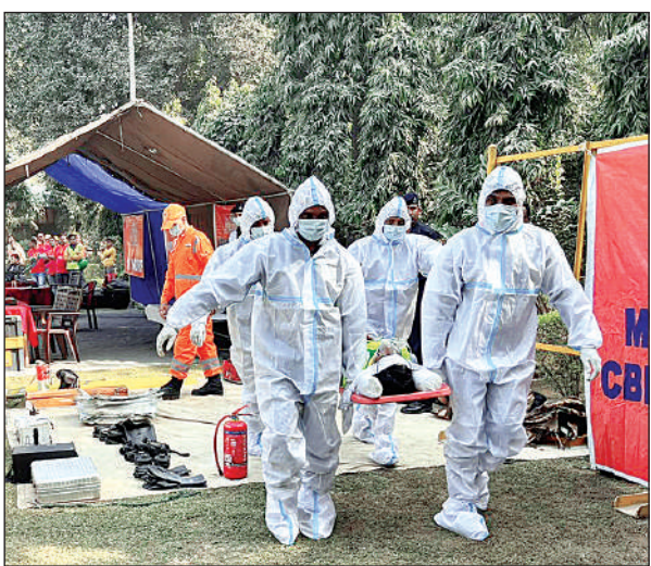
माँक ड्रिल करती एनडीआरएफ की टीम

अपर जिलाधिकारी ने विभिन्न विभागों को अपने दायित्वों के प्रति जागरूक रहकर आपदाओं में सदैव तैयार रहने हेतु एवं आपदा प्रबंधन विभाग को सभी फैक्ट्री कारखाने औद्योगिक इकाइयों की योजनाओं को अधिकतम करते हुए जिले को आपदा प्रबंधन योजना को अधिकतम करने के