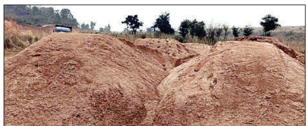
उप की गयी बालू

बीजपुर। जरहा वन रेंज क्षेत्र अंतर्गत विभिन्न नदियों से अवैध बालू खनन बेलगाम हो गया है। रोक टोक और जांच पड़ताल के लिए डीएम द्वारा गठित टीम मुकदमों के ट्रैक्टर और टीएच से रात को खनन कर जगह जगह जंगल झाड़ी में डीपिंग करने की होड़ लगी है। क्षेत्र के जरहा में अजीर नदी के नीमडांड बचाव मोखना डुमरचुवा राजो मोहारे गजरीडांड खरहरिया महरिकला के रिहन्द डैम सहित पिण्डारी के बिच्छी नदी महुली जलजलिया, तुरुक्की तथा