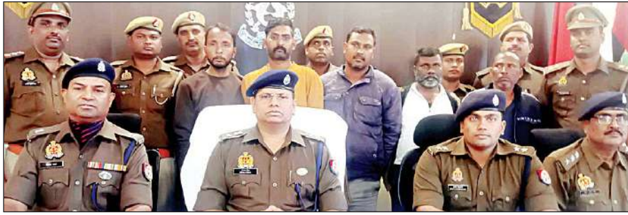
पुलिस की गिरफ्त में अवैध शस्त्र फैक्ट्री चलाने के आरोपित।

आजमगढ़। सिधारी थाना और स्वाट टीम प्रथम की संयुक्त टीमने मंगलवार की आधी रात बाद भदुली स्थित मौनी बाबा कुटिया के पास बांस की खूंटी के पीछे छापेमारी कर अवैध शस्त्र फैक्ट्री का