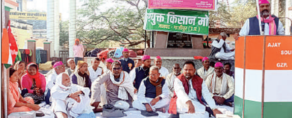
सरजू पाण्डेय पार्क में धरना देते मनरेगा मजदूर संघ के सदाधिकारी।

गाजीपुर। जिला निर्वाचन अधिकारी आर्यका अखौरी ने आज दिनांक 04 दिसम्बर, 2024 को जिला निर्वाचन कार्यालय स्थित ईवीएम गोदाम का मासिक निरीक्षण किया गया। निरीक्षण के दौरान ईवीएम एवं वीवीपेट मशीनों की सुरक्षा व्यवस्था, सीसीटीवी कैमरों की स्थिति, सुरक्षा कर्मियों की तैनाती और अन्य सूक्ष्म मामलों की विस्तृत समीक्षा करते हुए सम्बन्धित अधिकारियों को आवश्यक निर्देश दिये। इस अवसर पर दिनेश कुमार, अपर जिलाधिकारी (वि.रा.) गाजीपुर, सहायक जिला निर्वाचन अधिकारी गाजीपुर एवं अन्य सम्बंधित अधिकारीगण उपस्थित रहे।