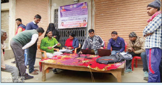
अतरौलिया क्षेत्र के पूरब पोखरे पर लगा विद्युत कैप

रजिस्ट्रेशन करवाने वाले को अधिक लाभ मिलेगा। उपभोक्ता इसका लाभ लेने पहुंचें तो समाधान करवाए। एसडीओ बृजेश कुमार राव ने बताया कि कैप में मंगलवार को 50 उपभोक्ताओं ने योजना में शामिल होकर 2 लाख 50 हजार रुपये बिल जमा किए। इस योजना का लाभ लोग