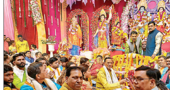
सोनभद्र। रामचरितमानस नवाह पाठ महायज्ञ के द्वितीय दिवस के अवसर पर राम जन्मोत्सव बड़े ही हर्षोल्लास के साथ मनाया गया। नवमी तिथि मधुमास पुनीता। शुक्ल पक्ष अभिजीत हरिप्रोता मध्य दिवस अति शीत न घामा। पावन काल लोक विश्रामा। दोनों पर दया करने वाले कौशलया के हितकारी कृपालु प्रभु प्रगट हुए-भए प्रगट कृपाला दीन दयाला कौशलया हितकारी। हर्षित महतारी मुनि मन हारी अद्भुत रूप निहारी। लोचन अभिराम तनु घनश्यामा निज आयुध भुज चारी। भूषण मन वनमाला नयन भूषण वनमाला नैन विशाला शोभा सिंधु खरारी।