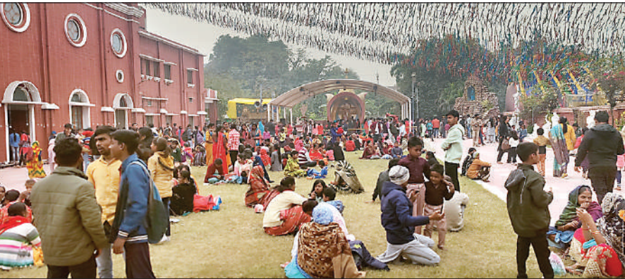
यूरोपियन कालोनी स्थित कैथोलिक चर्च में उमड़ी भारी भीड़।

डीडीयू नगर। प्रभु यीशु का जन्मोत्सव क्रिसमस के रूप में बुधवार को धूमधाम से मनाया गया। मसीही समुदाय के लोगों ने गिरजाघरों में सुख शांति के लिए प्रार्थना करने के बाद एक-दूसरे को बधाई दी। साथ ही घरों में केक काटा और एक-दूसरे का मुंह मीठा कराया।