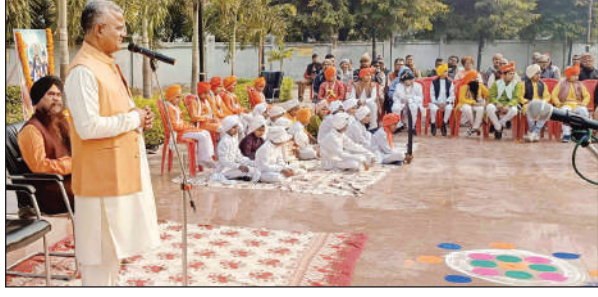
कार्यक्रम को संबोधित करते वक्ता