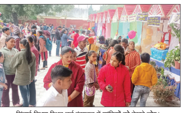
सिंचाई विभाग स्थित चर्च कंपाउड में झाकियों को देखते लोग।

गाजीपुर। जिले में क्रिसमस-डे सोमवार को उमंग और उत्साह के साथ मनाया गया। शहर के सिंचाई विभाग चौराहा स्थित लूई माता चर्च और तुलसीसागर स्थित पुराने चर्च में सजी झाकियों को देखने के लिए ईसाई समुदाय सहित अन्य समुदाय के लोगों की भीड़ उमड़ी। लूई माता चर्च में सुबह से लेकर शाम तक चहल-पहल रही। क्रिसमस डे को लेकर मसीही समुदाय में पिछले कई दिनों से जबरदस्त उत्साह था। लोग क्रिसमस-डे (बड़ा दिन) की