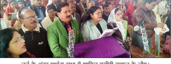
चर्च के अंदर प्रार्थना सभा में शामिल मसीही समाज के लोग।