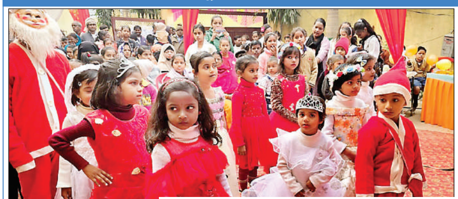
सेंट्रल पब्लिक स्कूल में आयोजित बाल मेले में प्रतिभाग करते नन्हें बच्चे।