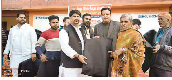
जरूरतमंदों को कंबल देते देवदूत के लोग