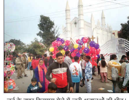
चर्च के बाहर क्रिसमस मेले में जुटी श्रद्धालुओं की भीड़।

तेक उफान पर दिखा। चर्च के बाहर लगे क्रिसमस मेले में तरह-तरह की दुकानें सजी थीं। शांता क्लाज रूपी