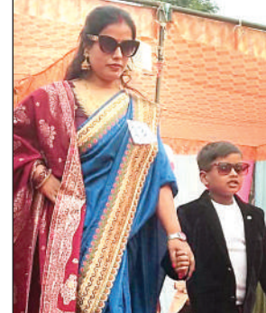
कार्यक्रम में अपने बच्चे के साथ रैंपवाक करती महिला

आजमगढ़। बुधवार को आराजीवाग स्थित विद्यालय के प्रांगण में पारम्परिक