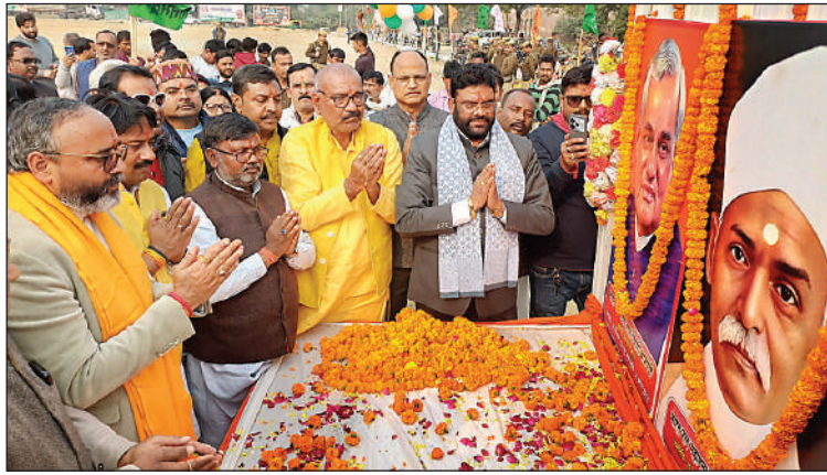
कलेक्ट्रेट सभागार में लाइव प्रसारण देखते अधिकारी