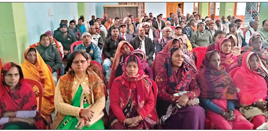
विश्वकर्मा उत्थान मंच के कार्यक्रम में उमड़ी भारी भीड़।