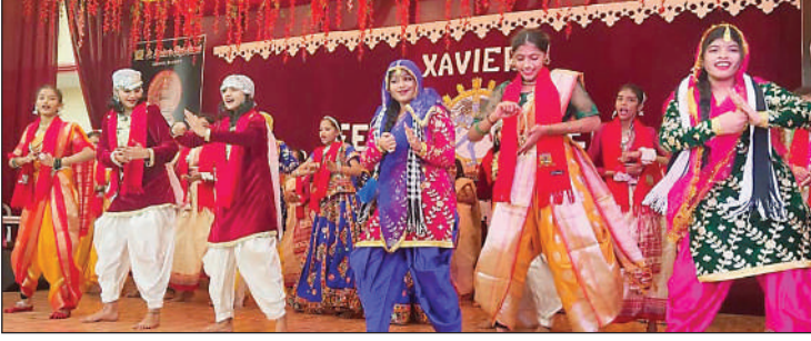
सांस्कृतिक कार्यक्रम प्रस्तुत करती विद्यालय की छात्राएं