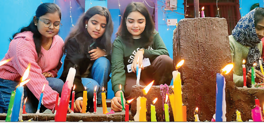
क्रिसमस-डे पर बिशुनीपुर स्थित चर्च में कैडिल जलाती छात्राएँ

बलिया। क्रिसमस-डे के अवसर पर शहर के विभिन्न स्कूलों एवं चर्चों पर विविध आयोजन किया गया। विद्यालयों में सांता क्लाज का रूप धारण कर अध्यापकों ने बच्चों को उपहार दिया। इस मौके पर लोगों ने एक-दूसरे को मैरी क्रिसमस कहकर बधाई दी। सेन्ट्रल मेथेडिस्ट चर्च