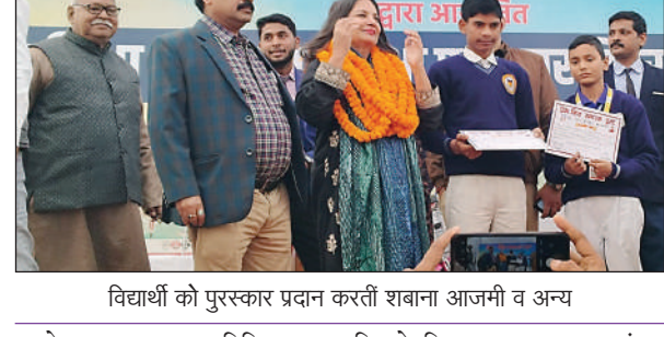
विद्यार्थी को पुरस्कार प्रदान करती शबाना आज़मी व अन्य