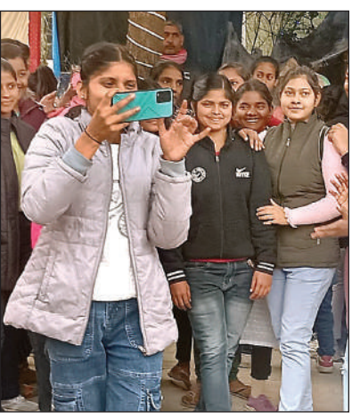
चर्च कंपाउड में क्रिसमस-डे पर सेल्फी लेती बालिका।

लूई माता चर्च में झांकी देखने के लिए उमड़ी भीड़, रही रौनक तैयारी में जुटे हुए थे। एक तरफ जहां चर्चों की साफ-सफाई और झाकियों से लेकर शाम तक चहल-पहल रही। क्रिसमस डे को लेकर मसीही समुदाय में पिछले कई दिनों से जबरदस्त उत्साह था। लोग क्रिसमस-डे (बड़ा दिन) की