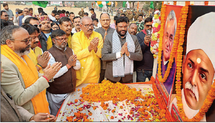
पूर्व पीएम अटल व मदन मोहन मालवीय के चित्र पर पुष्प अर्पित करते भाजपाई