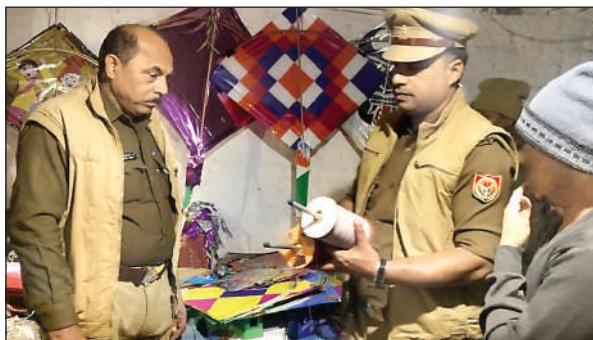
दुकानों अभियान चलाती पुलिस

उक्त अभियान में पुलिस कुल 79 दुकानों को चेक किया। चेकिंग के दौरान 131 बंडल चाइनीज मांझा की बरामद किया साथ ही 2 अभियुक्तों को किया गिरफ्तार सुरक्षा व्यवस्था के दृष्टिगत पुलिस ने पतंगबाजी में इस्तेमाल किए जाने वाले चाइनीज मांझे के खिलाफ एक खास अभियान चला रखा है। चाइनीज मांझे पर देश