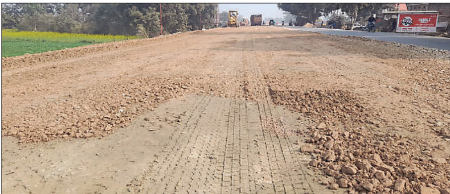
मानक के विपरीत हो रहा ग्रीन फील्ड एक्सप्रेस-वे का निर्माण

बैरिया। थरीलो से मांझी तक बनने वाले ग्रीन फील्ड एक्सप्रेस-वे के निर्माण में कार्यदाई संस्था द्वारा मानक के विपरीत कार्य कराये जाने से ग्रामीणों ने आक्रोश व्यक्त करते हुए इसकी जांच करने के लिए जिलाधिकारी से टीम गठित करने की मांग की है। उल्लेखनीय है कि फोरलेन की इस सड़क पर मिट्टी के बाद मिट्टी और गिट्टी के ऊपर मिट्टी डालकर रोलेर चला दिया जा रहा है। रोलेर चलाने के बाद इस पर मिट्टी के ऊपर पिच कर दिया जा रहा है। मऊ-गाजीपुर-वाराणसी के बीच जब फोरलेन सड़क का निर्माण हो रहा था तो देखा गया था कि मिट्टी के बाद