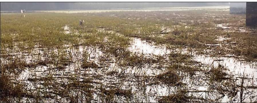
चहनियां खण्डवारी में पानी से नष्ट हुआ धान