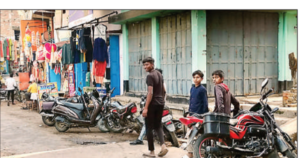
सहतवार में सड़क पर खड़े वाहन

सहतवार। स्थानीय नगर पंचायत स्थित दुर्गा मंदिर चौक के आस-पास प्रतिदिन अनाधिकृत तरीके से बाइक एवं साइकिल खड़े किये जाने से राहगीरों को काफी दिक्कतों का सामना करना पड़ता है। इससे पूरे चौक में हमेशा जाम की समस्या बनी रहती है। विगत दो सप्ताह सहित जिलाधिकारी के आदेश पर तहसीलदार बांसडीह, सहतवार थानाध्यक्ष एवं नगर पंचायत प्रशासक की संयुक्त टीम ने अनाधिकृत तरीके से सड़क के किनारे खड़े वाहनों तथा अतिक्रमण को हटवाया था।