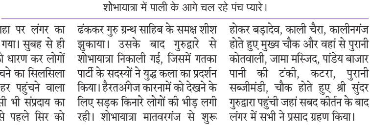
शोभायात्रा में पाली के आगे चल रहे पंच घ्यारे।

होकर बढ़ादेव, काली चौरा, कालीनगंज होते हुए मुख्य चौक और वहां से पुरानी कोतवाली, जामा मस्जिद, पांडेय बाजार पानी की टंकी, कटरा, पुरानी सब्जीमंडी, चौक होते हुए श्री सुंदर गुरुद्वारा पहुंची जहां सबद कीर्तन के बाद लंगर में सभी ने प्रसाद ग्रहण किया।