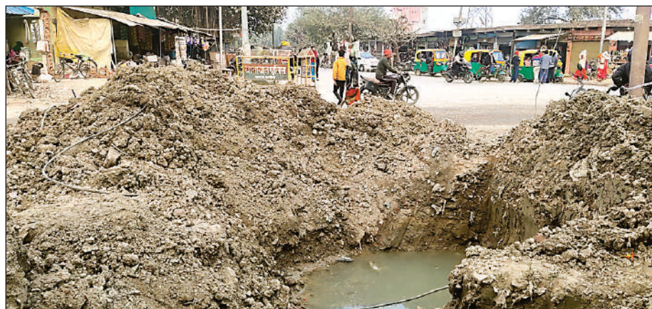
जल निगम की कनेक्शन जोड़े जाने को लेकर खोदा गया गड्ढा दुर्घटना को दे रहा दावत

वहीं दूसरी ओर फोर लेन सड़क निर्माण के दौरान जेसीबी से खोदाई करने के कारण पेयजल सप्लाई की व्यवस्था ठप है। आरोप है कि बीते दस दिनों से सधन तिराहे पर जल निगम की पाइप का कनेक्शन के लिये सड़क पर खोदा गया गड्ढा पाटना तो दूर कनेक्शन सड़क के दूसरी ओर नहीं किये जाने से दर्जनों उपभोक्ता पेयजल