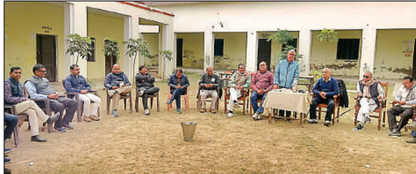
सकलडीहा इंटर कॉलेज में मंडलीय सम्मेलन की तैयारी को लेकर चर्चा करते हुए शिक्षक संघ के पदाधिकारी

सकलडीहा। उत्तर प्रदेश माध्यमिक शिक्षक संघ जनपद चंदौली इकाई के पदाधिकारियों की बैठक रिविवार को सकलडीहा इंटर कॉलेज परिसर में हुई। इस दौरान आगामी 10 जनवरी को बाल्मीकि इंटर कॉलेज बलुआ में आयोजित मंडलीय सम्मेलन के संदर्भ में चर्चा किया गया। इस मौके पर पूर्व में हुई 11 दिवसीय धरना प्रदर्शन की सफलता पर विस्तार से चर्चा किया गया। बैठक में संगठन के पदाधिकारियों ने बताया कि