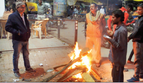
मुख्यालय स्थित पुलिस चौकी के समीप अलाव तापते लोग

बूदाबादी ने बढ़ाई गलन, ठंड से ठिठुरे लोग