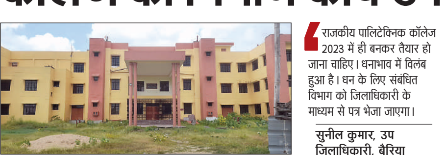
निर्माणाधीन राजकीय पॉलिटेक्निक