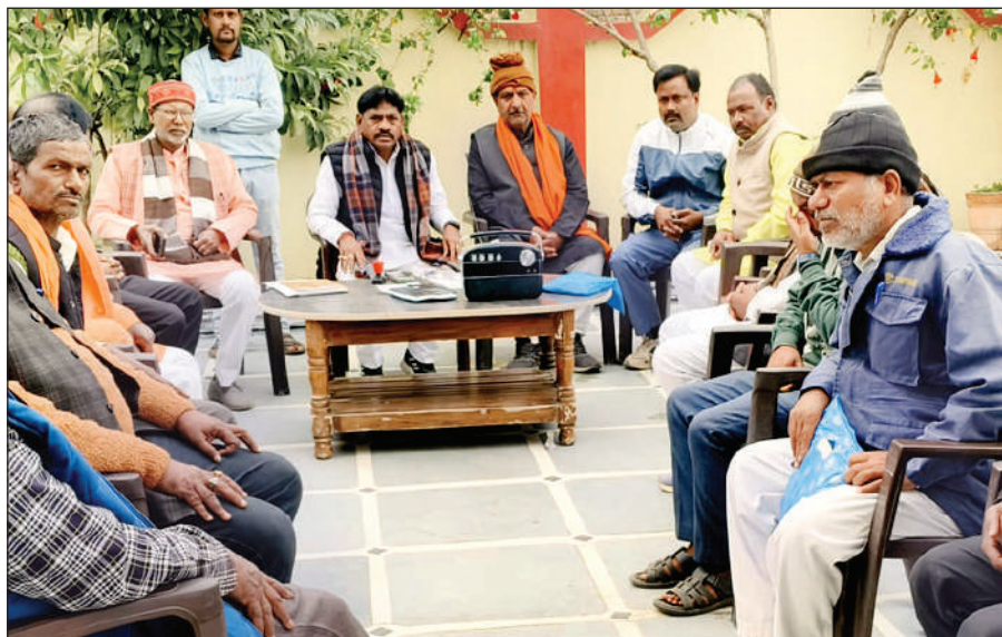
ओबरा विधानसभा कार्यालय पर मन की बात सुनते राज्यमंत्री संजीव कुमार गोड़

डाला। ओबरा विधायक व सूबे के समाज कल्याण राज्य मंत्री संजीव सिंह गौड़ ने बाड़ी स्थित अपने आवास पर भाजपा के पदाधिकारियों और कार्यकर्ताओं के साथ रविवार को पीएम मोदी के मन की बात सुनी। प्रधानमंत्री नरेंद्र मोदी ने अपने रेडियो कार्यक्रम 'मन की बात' के जरिए लोगों को संबोधित किया। इस दौरान उन्होंने लोगों को नए साल की शुभकामनाएं दीं। इसके अलावा पीएम मोदी ने संविधान पर भी बात की। 'मन की बात' के 117वें एपिसोड में पीएम मोदी ने कहा कि 2025 में 26 जनवरी को हमारे संविधान को लागू हुए 75 वर्ष होने जा रहे हैं। हम सभी के लिए बहुत गौरव की बात है। हमारे संविधान निमार्ताओं ने हमें जो संविधान सौंपा है, वो समय की हर कसौटी पर खरा उतरा है। संविधान हमारे लिए दिशा दिखाने वाली रोशनी है, हमारा मार्गदर्शक है। यह भारत का संविधान ही है जिसकी वजह से वह आज यहां हैं। मन की बात सुनने