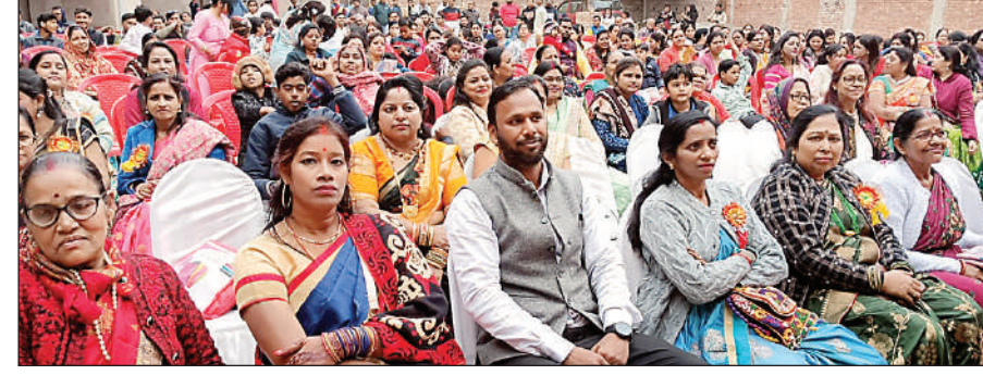
महाराजा अहिबरन जयंती समारोह में शामिल लोग

भदोही। बरनवाल सेवा समिति की ओर से नगर के रामलीला मैदान में रविवार को महाराजा अहिबरन की जयंती बड़े ही धूमधाम से मनाई गई। जिसमें संगठन की मजबूती पर बल दिया गया और रंगारंग व सांस्कृतिक कार्यक्रम का आयोजन किया गया। कार्यक्रम की शुरुआत समिति के पदाधिकारियों ने महाराजा श्री अहिबरन की तस्वीर पर माल्यार्पण व दीप प्रज्वलित करके तथा उन्हें गुलाल का