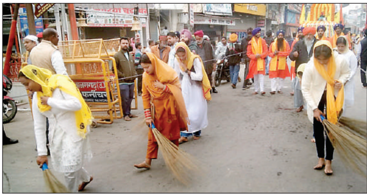
शोभायात्रा के रास्ते की सफाई करती महिला श्रद्धालु।

आजमगढ़। सिख समुदाय के दसवें और अंतिम गुरु गोविंद सिंह के 358वें प्रकाशोत्सव पर रविवार को आस्था की गर्मी का अहसास हुआ। शोभायात्रा में गुरु की पालकी के आगे नंगे पांव चले घ्यारे चल रहे थे, तो उसके आगे महिलाएं नंगे पांव रास्तों की सफाई करते आगे बढ़ रही थीं। दो दिनों से ठंड मौसम के बीच सड़क पर नंगे पांव चलते श्रद्धालुओं को देख यही लग रहा था कि आस्था के आगे कोई भी मौसम बेअसर हो जाता है।