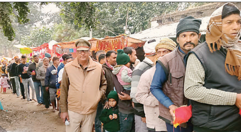
अधिक भीड़ रही।

दर्शनार्थियों ने मेले में लगी दुकानों से प्रसाद तथा सौंदर्य प्रसाधन सामग्री की खरीददारी की। महिला भक्तों की