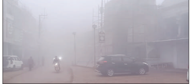
कोहरे की चादर से ढकी शहर की अटाला मस्जिद

जौनपुर। जनपद में दो दिन से हो रही हल्की बारिश के बाद रविवार की अलसुबह घना कोहरा छाया रहा। दो दिन से सूर्य देवता के दर्शन लोगों को नहीं हो रहे थे। हालांकि इस बार ठण्ड काफी विलम्ब से पड़ना शुरू हुई है लेकिन ठण्ड की दस्तक ने पहले ही झोंके में सबको हिलाकर रख दिया। आज पहला दिन होगा जब हर किसी के घर, सड़क, चौराहों आदि स्थानों पर अलाव, हीटर आदि माध्यमों की आवश्यकता पड़ी होगी। ठंड के साथ कोहरे ने भी दस्तक देना शुरू कर दिया है। सुबह लोग जब