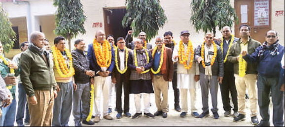
उत्तर प्रदेश माध्यमिक शिक्षक संघ भदोही इकाई के चुने गए पदाधिकारियों का