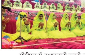
सीपीएस में दुआखानी करती बच्चियां।