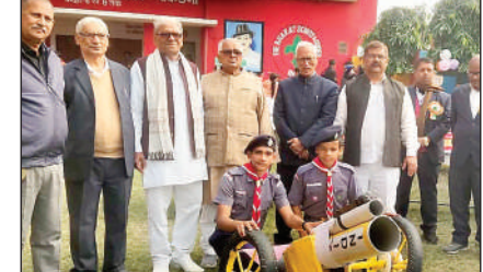
पुरानी तोप मॉडल का अवलोकन करते अतिथिगण।