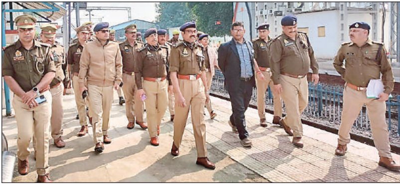
रेलवे स्टेशन का निरीक्षण करते एडीजी जोन