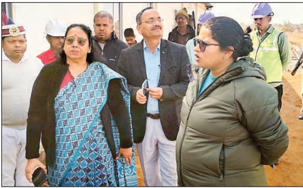
निरीक्षण करती डीएम

निरीक्षण के दौरान कार्य की धीमी प्रगति पर जिलाधिकारी द्वारा कड़ी नाराजगी व्यक्त करते हुए मजदूरों की संख्या बढ़ाने तथा कार्य में तेजी लाकर ससमय पूर्ण कराने का निर्देश दिया। निरीक्षण के दौरान मुख्य मार्ग, बाउंड्री वाल, प्रशासनिक भवन, कुल सचिवालय, प्रशासक भवन, कुल सचिवालय आवास तथा एंकेडमिक भवन के प्रथम तल को मई 2025 तक पूरा करने का