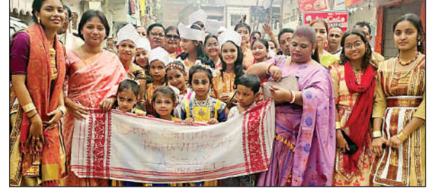
रंग यात्रा में शामिल कलाकार।

आजमगढ़। सामाजिक, साहित्यिक एवं सांस्कृतिक संस्था हुनर संस्थान की ओर से प्रतिभा निकेतन इंटर कॉलेज में आयोजित हुनर रंग महोत्सव अखिल भारतीय नाटक और लोक नृत्य समारोह के चौथे दिन देश भर से आए हुए कलाकारों ने रंग यात्रा निकाली और सड़क को मंच बनाकर विविध प्रस्तुतियां दीं। राष्ट्रीय एकात व अखंडता का संदेश देते हुए यह कलाकार जब नगर की सड़कों पर विभिन्न परिधानों में निकले तो लगा मानो पूरा भारत नगर की सड़कों पर उतर आया हो। 14 प्रदेशों के