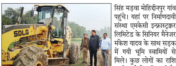
कार्य में तेजी