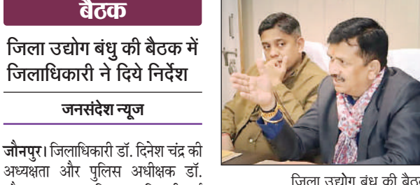
जिला उद्योग बंधु की बैठक को सम्बोधित करते डीएम

उद्यमियों को भी सहयोग करने की भी अपील की। उन्होंने होल्डिंग परिया बनाए जाने के दौरान सहयोग करने की अपील की जिससे महाकुंभ पर्व को जनसहयोग से