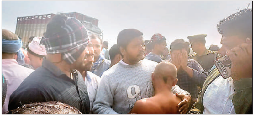
चक्का जाम करते ग्रामीण

भोलापुर इमीलिया गांव के समीप अमडा तुलसी आश्रम रोड पर आ रही इंडेन गैस लदी ट्रक ने जोरदार टक्कर मार दी जिससे युवक रोड पर गिर गया और ट्रक उसके उपर चढ़ गई जिससे उसकी मौके पर मौत हो गई। आसपास के लोग दौड़ कर घटना स्थल पर पहुंचे तब तक ट्रक चालक मौके पर ट्रक छोड़ कर फरार हो गया। आक्रोशित ग्रामीणों ने