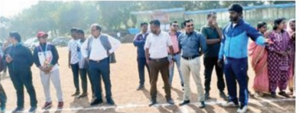
दबंग दुनिया • सवती

आज दिनांक 29 नवंबर 2024 को सती के नंदेली भाटा खेल मैदान में जिला स्तरीय महिला खेलकूद प्रतियोगिता का आयोजन किया गया। जिसमें खो-खो, बैडमिंटन, वॉलीबॉल, फुटबॉल, कुश्ती, रस्सा कसी, बार्सेटबॉल, वेटलिफ्टिंग, 100 मीटर, 400 मीटर दौड़ एवं तवा फेक का खेल संपन्न हुआ। इस प्रतियोगिता में मालखरीद, सती, जैनेपुर एवं उधरा विकासखंड के महिला खिलाड़ियों ने सम्मिलित होकर अपने-अपने खेलों का प्रदर्शन किया। महिलाओं का यह खेलकूद प्रतियोगिता दो वर्षों में आयोजित हुआ था 9 से 18 वर्ष एवं 18 से 35 वर्ष। इस खेल प्रतियोगिता में चारों विकासखंड से लगभग 210 महिला खिलाड़ियों ने भाग लिया। इस खेल प्रतियोगिता को उद्घाटन सती के