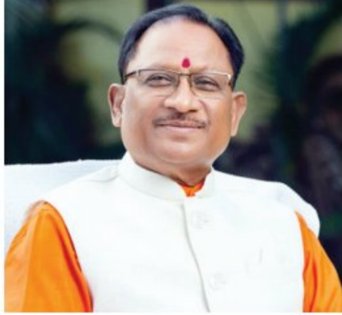
शासन द्वारा मिलर्स के बीते वर्षों के बकाया प्रांश का जल्द ही भुगतान के आश्वासन के साथ उनके अन्य मांगों का हल निकाला गया।

छत्तीसगढ़ में धान उपाजर्जन केन्द्रों से धान का उठाव न होने के कारण केन्द्रों में जाम की स्थिति और किसानों को धान बेचने में हो रही दिक्कत का समाधान हो गया है। मुख्यमंत्री विष्णु देव साय की पहल पर शासन स्तर पर इस समस्या के समाधान के लिए लघु उद्योग भारती एवं भारतीय किसान संघ के साथ राईस मिल एसोसिएशन के पदाधिकारियों के बीच हुई सकारात्मक बातचीत से राईस मिलर्स ने धान खरीदी केन्द्रों से धान का निर्यात रूप से उठाव करने और कस्टम मिलिंग जारी रखने का निर्णय लिया है।