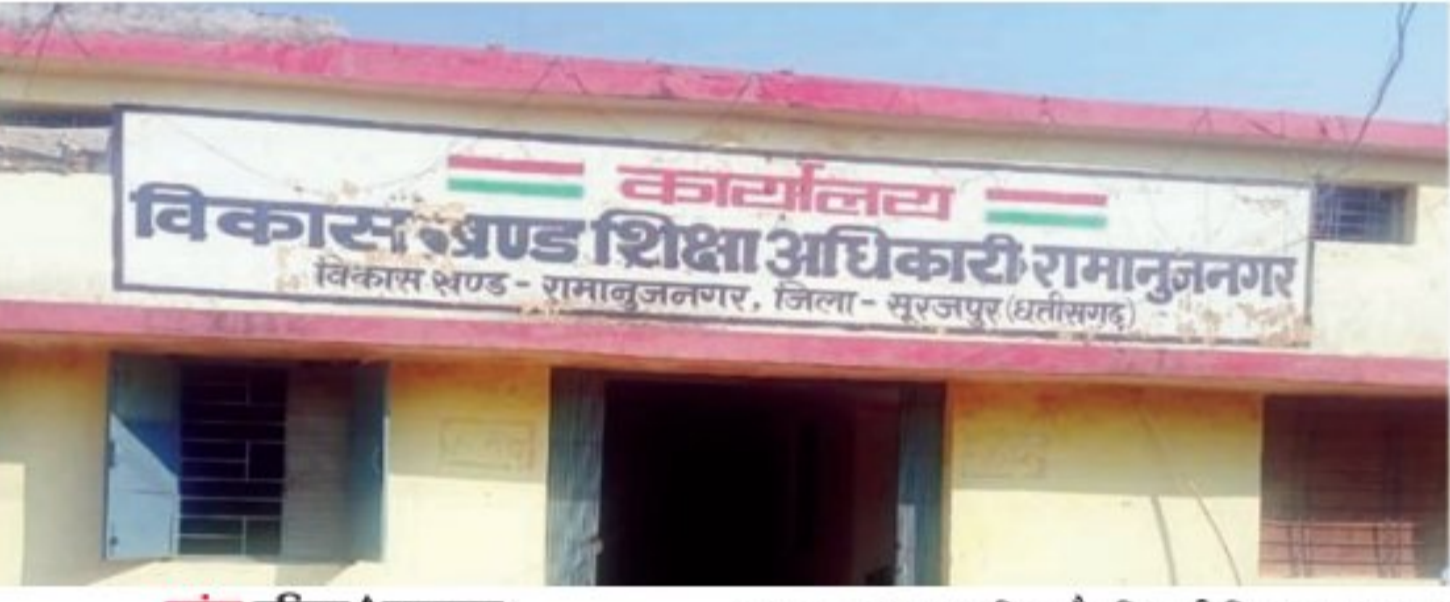
दबंग दुनिया ✦ सुरजपुर