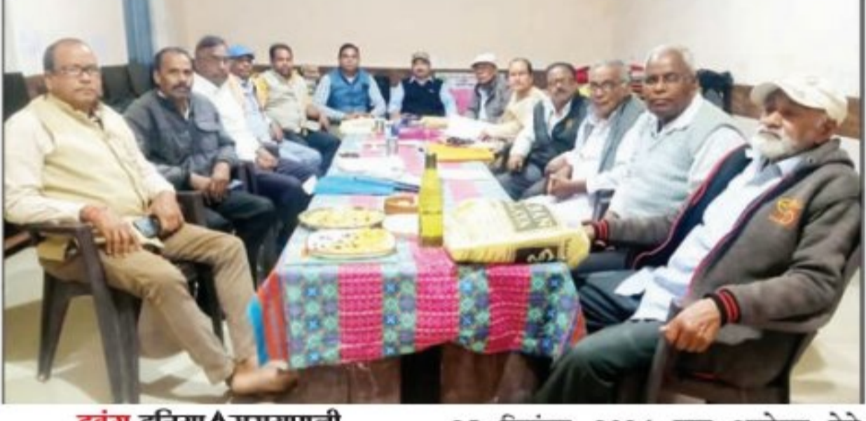
दबंग दुनिया ✦ सरायपाली

आर एस इंग्लिश मीडियम हाईस्कूल बार्डोजोर सरायपाली द्वारा फुलझर क्षेत्र के प्रतिभाओं को प्रोत्साहन के लिए लगातार तीसरा वर्ष सम्मानित किया जाएगा। जिसके लिए आवेदन मंगवाये जा रहे हैं।