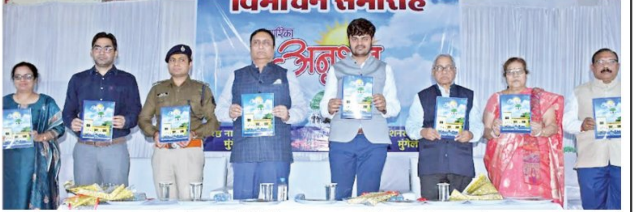
दबंग दुनिया • मुंगेली