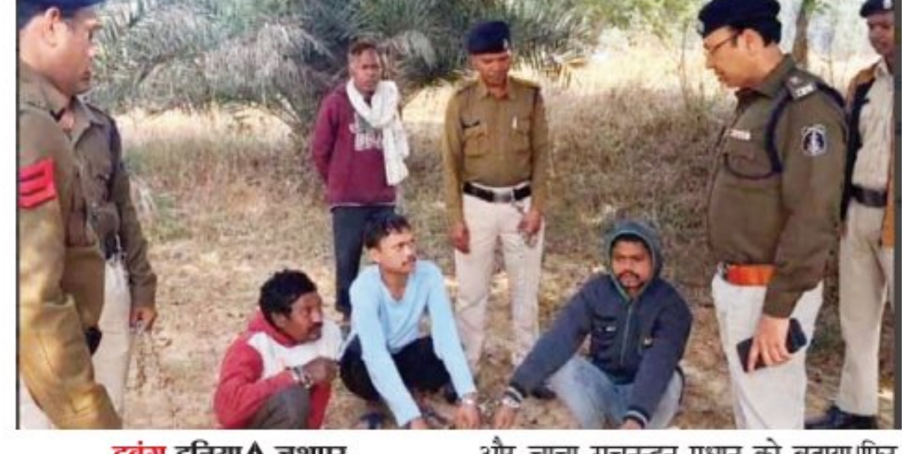
दबंग दुनिया ✦ जशपुर