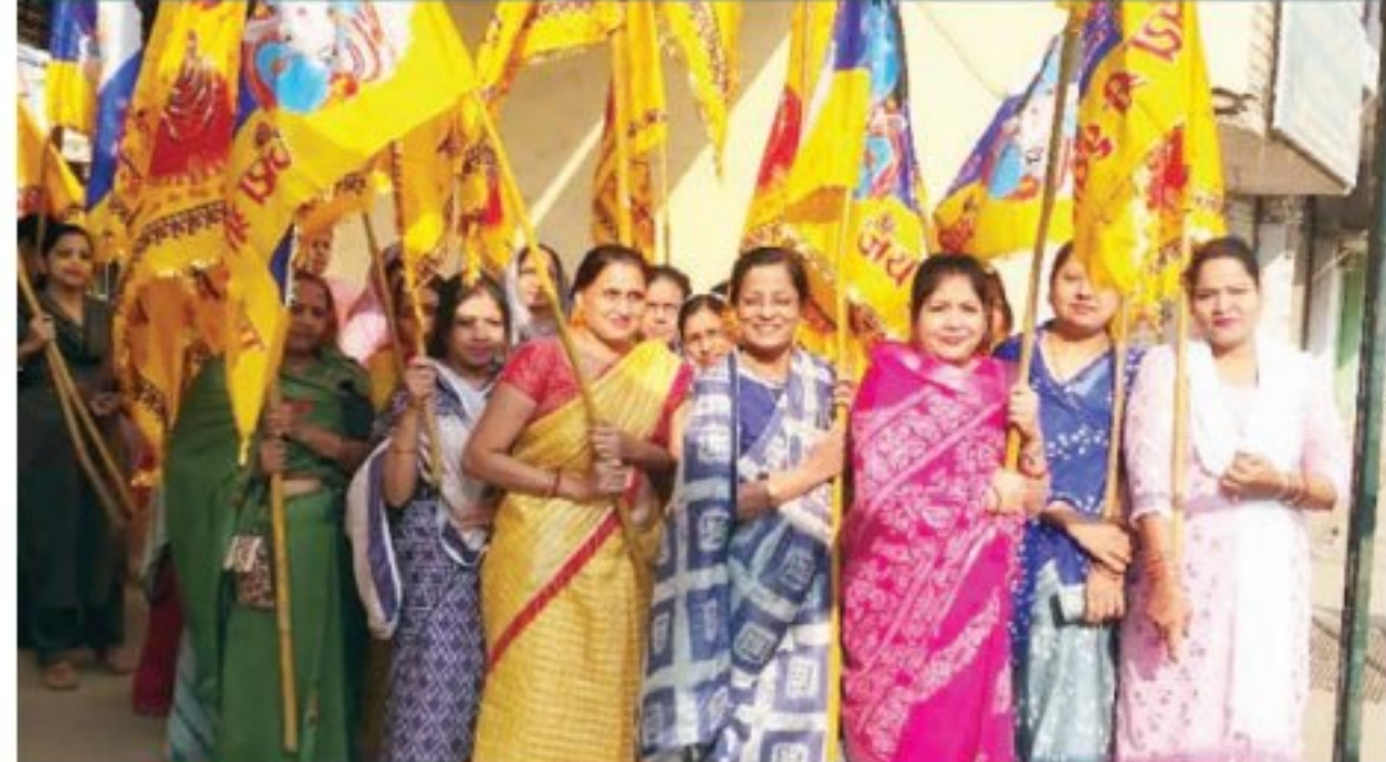
दबंग दुनिया ✦ पत्यलगांव

वही सड़कों पर जयकारों की गुंज से वातावरण भक्तिमय हो उठा। इस दौरान सड़कों में आवाजाही सुचारू रूप से चल सके जिसे लेकर श्याम श्रद्धालुओं ने कतारबद्ध होकर इस निशान यात्रा में समापन की जाती है। जिसमें सैकड़ों की संख्या में श्रद्धालु मौजूद होते हैं। बुधवार को ग्यारस मोक्षदा एकादशी के मौके पर भक्तों ने सुबह 9-00 बजे हाथों में लाल व पीले रंग के श्याम ध्वज लिए एवं भक्तों में लीन होकर जय श्री श्याम के जयकारों लगाते निशान यात्रा में अग्रसर दिखे।