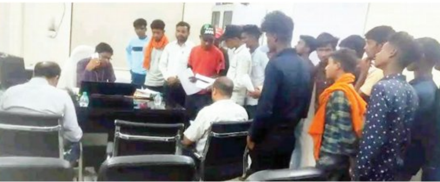
दबंग दुनिया ✦ सूरजपुर

संयुक्त कलेक्टर ने ज्ञापन पर सहानुभूतिपूर्वक विचार करते हुए इसे जिला मेडिकल बोर्ड को भेजने का आश्वासन दिया। उन्होंने यह भी कहा कि जल्द से जल्द इस समस्या का समाधान निकालने के लिए प्रयास किए जाएंगे। ग्रामीणों का आक्रोश और प्रशासन से उम्मीद