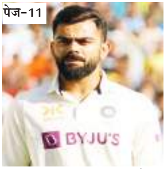
विराट कोहली को कप्तान बना सकता है...