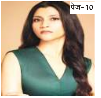
अलग किरदार निर्भाई कोंकणा सेन.....