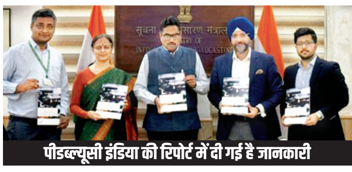
पोडब्यूसी इंडिया की रिपोर्ट में दी गई है जानकारी

देश में मनोरंजन और मीडिया इंडस्ट्री का राजस्व 2028 तक 3,65,000 करोड़ रुपये तक पहुंचने का अनुमान है, जो 8.3 प्रतिशत की चक्रवृद्धि वार्षिक वृद्धि दर (सीपीआईआर) है। सोमवार को जारी एक रिपोर्ट में बताया गया कि भारतीय मनोरंजन और मीडिया इंडस्ट्री का राजस्व चार वर्षों में वैश्विक दर 4.6 प्रतिशत से आगे निकल जाएगा।