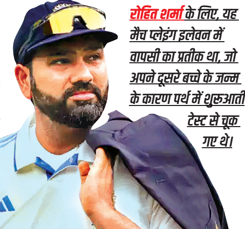
रोहित शर्मा के लिए, यह मैच प्लेइंग इलेवन में वापसी का प्रतीक था, जो अपने दूसरे बच्चे के जन्म के कारण पथ में शुरुआती टेस्ट से चूक गए थे।