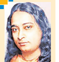
श्री श्री परमहंस योगानंद

प्रत्येक को तर्क और भावना, दोनों के आंतरिक संतुलन के लिए प्रयास करना चाहिए ताकि वह एक सम्पूर्ण व्यक्तित्व, सम्पूर्ण मनुष्य बन जाए। ईश-सम्पर्क से आप अपने भीतर इन दोनों गुणों में सामंजस्य अथवा सन्तुलन लाते हैं। महान सन्तों में हम पुरुष-स्वभाव और स्त्री-स्वभाव के आदर्श गुणों को संयुक्त हुए देखते हैं। जिससे ऐसे ही थे; सभी गुरुजन भी ऐसे ही थे। जब आप तर्क एवं भावना