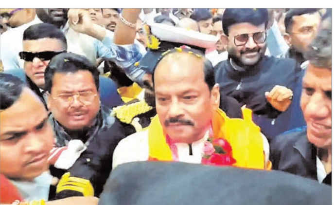
उनकी क्या भूमिका होगी, यह उनकी पार्टी तय करेगी। वह दो बार प्रदेश अध्यक्ष,

कार्यकर्ता सामान्य कार्यकर्ता से पार्टी या सरकार के सर्वोच्च पद तक पहुंच सकता है। ओडिशा की जनता के प्रति आभार व्यक्त करते हुए कहा कि महाप्रभु जगन्नाथ की धरती ओडिशा में साढ़े 14 महीने तक वहां के लोगों का जो प्यार मुझे मिला, वह मेरे जीवन के अविस्मरणीय क्षण हैं। मेरी प्रभु जगन्नाथ से प्रार्थना है कि ओडिशा की धरती जब शताब्दी वर्ष मनाए, तब तक यह विकसित राज्य बन जाए। उनकी भविष्य की योजनाओं के बारे में पूछने पर उन्होंने कहा कि उनकी कोई महत्वाकांक्षा नहीं है। भाजपा में अब