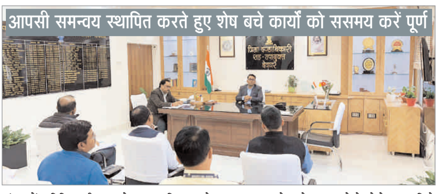
आपसी समन्वय स्थापित करते हुए शेष बचे कार्यों को तय समय करें पूर्ण प्रांगण में सुनिश्चित की जा सके। आगे उपायुक्त ने एम्स के नजदीक क्षेत्र में केन्द्रीय विद्यालय के अस्थाई संचालन हेतु सरकारी भवन