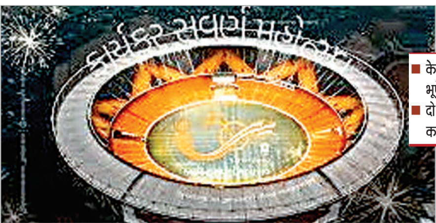
महोत्सव इसी जनवरी 2024 में सूरत में शुरू हुआ था, अब इसका समापन 7 दिसंबर को अहमदाबाद में होगा। इसमें विभिन्न बीएपीएस केंद्रों के उन कार्यकर्ताओं के सम्मान में समारोह आयोजित किया गया है,