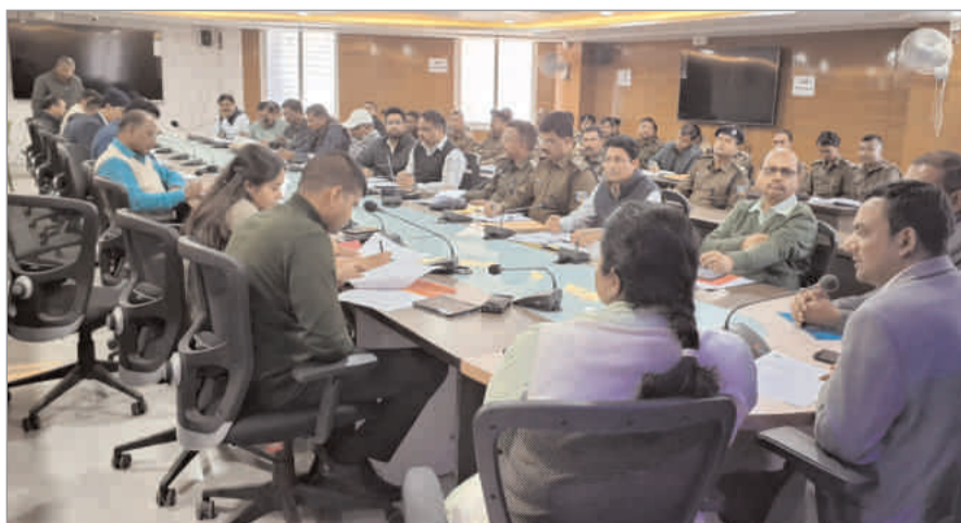
करते हुए कार्रवाई करने की बात कही। उन्होंने जिला खनन पदाधिकारी एवं सभी अनुमंडल पदाधिकारियों को आपस में समन्वय बनाकर अवैध माइनिंग के विरुद्ध छापामारी करने कि