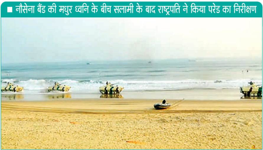
नौसेना बैंड की मधुर ध्वनि के बीच सलामी के बाद राष्ट्रपति ने किया परेड का निरीक्षण

एजेंसी नयी दिल्ली : भारतीय नौसेना ने बुधवार को नौसेना दिवस पर ओडिशा में पुरी के ब्लू फ्लैग बीच पर ऑपरेशनल प्रदर्शन (ऑप डेमो) के माध्यम से अपनी ऑपरेशनल शक्ति का प्रदर्शन किया। भारतीय सशस्त्र बलों की सर्वोच्च कमांडर राष्ट्रपति द्रौपदी मुर्मू के समक्ष हुए ऑपरेशन डेमो के लिए 3500 से अधिक कर्मियों को समुद्र में प्लेटफॉर्म पर तैनात किया गया और 350 कर्मी तट पर समन्वय में शामिल हुए। राष्ट्रपति मुर्मू को पहुंचने पर सबसे पहले गार्ड ऑफ ऑनर दिया गया। उन्होंने नौसेना बैंड की मधुर ध्वनि के बीच परेड का निरीक्षण किया, जिसके बाद उन्हें सलामी दी गई।