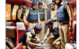
के आधार पर उनकी टीम ने मंगलवार को मुंबई में सड़िध बस को रोककर छापा मारा गया। इस बस में सफर कर रहे 3 लोगों के सामान की तलाशी लेने पर तीनों के पास 24 करोड़ का सफेद पाउडर और 1.93 करोड़ रुपये कैश मिले। इस सफेद पाउडर की केमिकल जांच की गई तो इसकी पहचान एमडी ड्रग (मेफेट्रोन) के रूप में की गई।

एजेंसी मुंबई : राजस्व खुफिया निदेशालय (डीआरआई) की टीम ने मुंबई में हैदराबाद से आ रही निजी बस में छापा मारकर 16 किलोग्राम एमडी ड्रग्स और 1.93 करोड़ रुपये कैश जप्त किया है। बरामद ड्रग्स की कीमत 24 करोड़ रुपये आंकी गई है। इस मामले में डीआरआई ने पांच लोगों को गिरफ्तार किया है। डीआरआई टीम इस मामले की गहन छानबीन कर रही है। डीआरआई के एक अधिकारी ने बुधवार को बताया कि उनकी टीम को हैदराबाद से मुंबई आ रही निजी बस में ड्रग्स आने की गोपनीय जानकारी मिली थी। इसी जानकारी