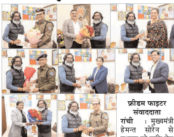
फ्रीडम फाइटर संवाददाता रांची : मुख्यमंत्री हेमन्त सोरेन से बुधवार को कांके रोड सीएम से मिले पुलिस-प्रशासन के आलाधिकारी