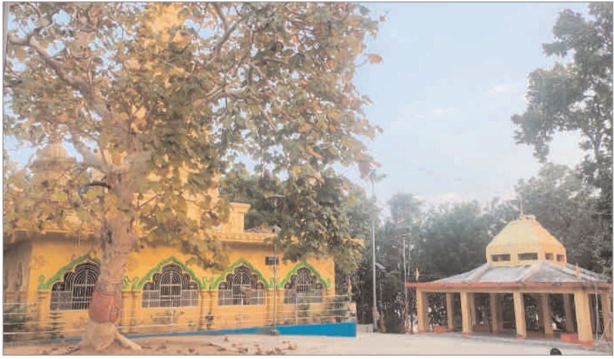
पौराणिक प्रतिमा स्थापित है। यहां पहुंचने वाले आगंतुक मंदिर में मत्था टेकते हैं और नव वर्ष के

की तैयारी में जुटा हैं, वहीं बुजुर्गों की टोली विभिन्न मठ-मंदिरों में मत्था टेककर नव वर्ष की शुरूआत करना चाहते हैं। इस वर्ष विशेष तौर पर पिकनिक स्पॉट पर लोग अभी से ही दिखने लगे हैं। बुढ़े, युवा, बच्चे, महिला व पुरुष सभी नव वर्ष के स्वागत और वनभोज की तैयारी कर रहे हैं। चतरा जिले के पथलगाड़ा में कई पिकनिक स्पॉट हैं। जहां लोग परिवारों के साथ पहुंचकर वनभोज का आनंद उठाते हैं।