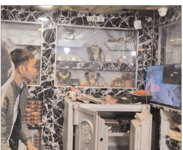
बिल्कुल ही नहीं है एवं इलाके में इस तरह की पहली घटना है इन दिनों घाघरा में अपराधिक

फ्रीडम फाइटर संवाददाता गुमला : गुमला लोहरदगा नेशनल हाइवे पर एवम घाघरा थाना से महज 200 मीटर दूरी पर स्थित मां जगदंबा ज्वेलर्स में शटर तोड़कर चोरों ने करीब-5 लाख गहने पर हाथ साफ कर पुलिस को खुली चुनौती दे डाली। घटना स्थल के बगल में बैंक ऑफ इंडिया की शाखा है। उपर वाले की दया से बैंक को किसी तरह का नुकसान नहीं हुआ है। घटना के बाद से व्यापारियों और स्थानीय लोगों में डर एवं पुलिस के प्रति रोष है। लोगों का कहना था कि जिस प्रकार से चोरी की घटना को अज्ञाम दिया गया है इससे लगता है कि चोरों में पुलिस का भय