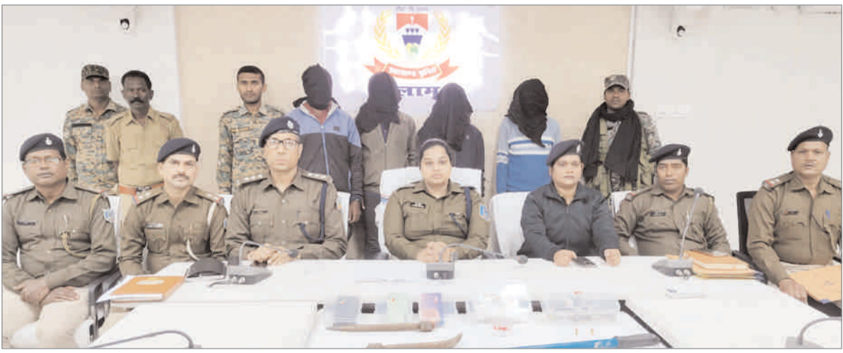
निदेशानुसार एक छापामारी टीम का गठन किया गया। काण्ड अनुसंधान के काम में दिनांक 07/12/2024