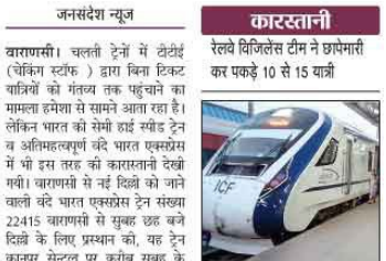
वाराणसी। चालती ट्रेनों में टीटीई (चैकन स्टॉफ) द्वारा बिना टिकट यात्रियों को गंतव्य तक पहुंचाने का मामला उभरने से सामने आया है।

वैद्यक से संबंधित दुर्घटनाएं घटाने के लिए सख्त कानून बनाने का निर्देश दिया।