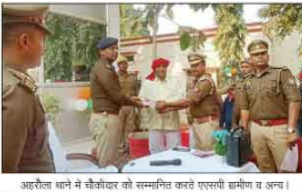
आधुनिक धार में चौकीदार को सम्मानित करते एएसपी ग्रामीण व अन्य।