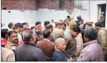
पोस्टमार्टम के लिए भेज दिया। जानकारी के अनुसार दवाखाने गुना (82) शिक्नर कालोनी नक्खोटाट (सामनाथ) में मकान बनकर रहने के दो सालों के बाद आग में जल चुका था।

जनसंदेश न्यूज वाराणसी। माननाथ शिक्नर कालोनी नक्खोटाट स्थित एक मकान में सोमवार को शाम 8 बजे शॉट साईक्रे से लगी आग में जिंदा जल गए। जिससे उसके मौत हो गई। मौके पर पहुंचे फायर ब्रिगेड की टीम ने लगभग आधे घंटे की मेहनत के बाद आग पर कब्जा पड़ा। लेकिन तब तक शव पूरी तरह जल चुका था। शव को स्थानीय पुलिस कब्जे में लेकर परिजनों को सुपान कर