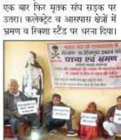
रिश्वात स्टैंड पर धरना देते लाख विहारी मृतक।

1976 को ग्राम खलीलाबाद के भू-राजस्व अधिकारियों ने जीवित को मृत घोषित कर दिया गया था।