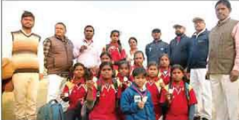
गोल्ड मेडल के साथ बालिका टीम।

दौलतपुर (आजमगढ़)। भद्रक जूनियर बालिका वॉलीबॉल में फुलेस को गोल्ड मेडल