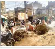
शहर के नवाब युसुफ रोड पर सड़क के बीच में गढ़ा खाद देने के कारण आये दिन लोग जाम से परेशान रहते हैं।