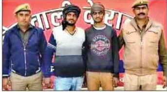
पुलिस की विरप्ता में असलम के हत्याकांडी

धरा आला-ए-कल्ल के साथ विवर की 8 केन भी बरामद