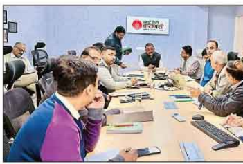
वाराणसी। महापौर ने भवन में क्यू.आर.कोड चस्प्या करने में लापरवाही करने वाले अधिकारियों के विभागीय समीक्षा बैठक का आयोजन करा।

वाराणसी। चालती ट्रेनों में टीटीई (चैकन स्टॉफ) द्वारा बिना टिकट यात्रियों को गंतव्य तक पहुंचाने का मामला उभरने से सामने आया है।