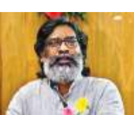
स्थित कैमरून भेजा गया है जो गैरकानूनी है। मुख्यमंत्री हेमंत सोरेन को विगत

रांची। मुख्यमंत्री हेमंत सोरेन के निर्देश के बाद कैमरून (मध्य अफ्रीका) में फंसे झारखंड के श्रमिकों के वेतन भुगतान की प्रक्रिया शुरू कर दी गई है। मुख्यमंत्री ने कैमरून में फंसे झारखंड के 47 प्रवासी श्रमिकों के वेतन भुगतान नहीं किए जाने के संदर्भ में प्राप्त शिकायत पर श्रमायुक्त को निर्देश दिया कि नियोजकों, नियोक्ताओं और मिडिलमैन के विरुद्ध एफआईआर दर्ज करने की कार्रवाई करें। मुख्यमंत्री के आदेश के बाद गुरुवार को श्रमायुक्त ने नियोजकों, नियोक्ताओं और मिडिलमैन के विरुद्ध हजारीबाग, बोकारो और गिरिडीह में प्राथमिकी दर्ज करा दी है। प्राथमिकी में इस बात का भी जिक्र किया गया है कि नियोजकों, नियोक्ताओं और मिडिलमैन को अन्तरराज्यीय प्रवासी श्रमिक (नियोजन का विनियमन और सेवा शर्त) अधिनियम, 1979 के तहत बिना प्रवासी मजदूर के रूप में निबंधन कराये और बायर लाइसेंस प्राप्त किए, धोखे से और जालसाजी कर मध्य अफ्रीका