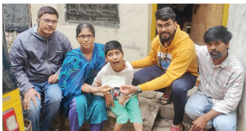
SCS Charitable Trust from the colony gave a check of 12 thousand rupees.