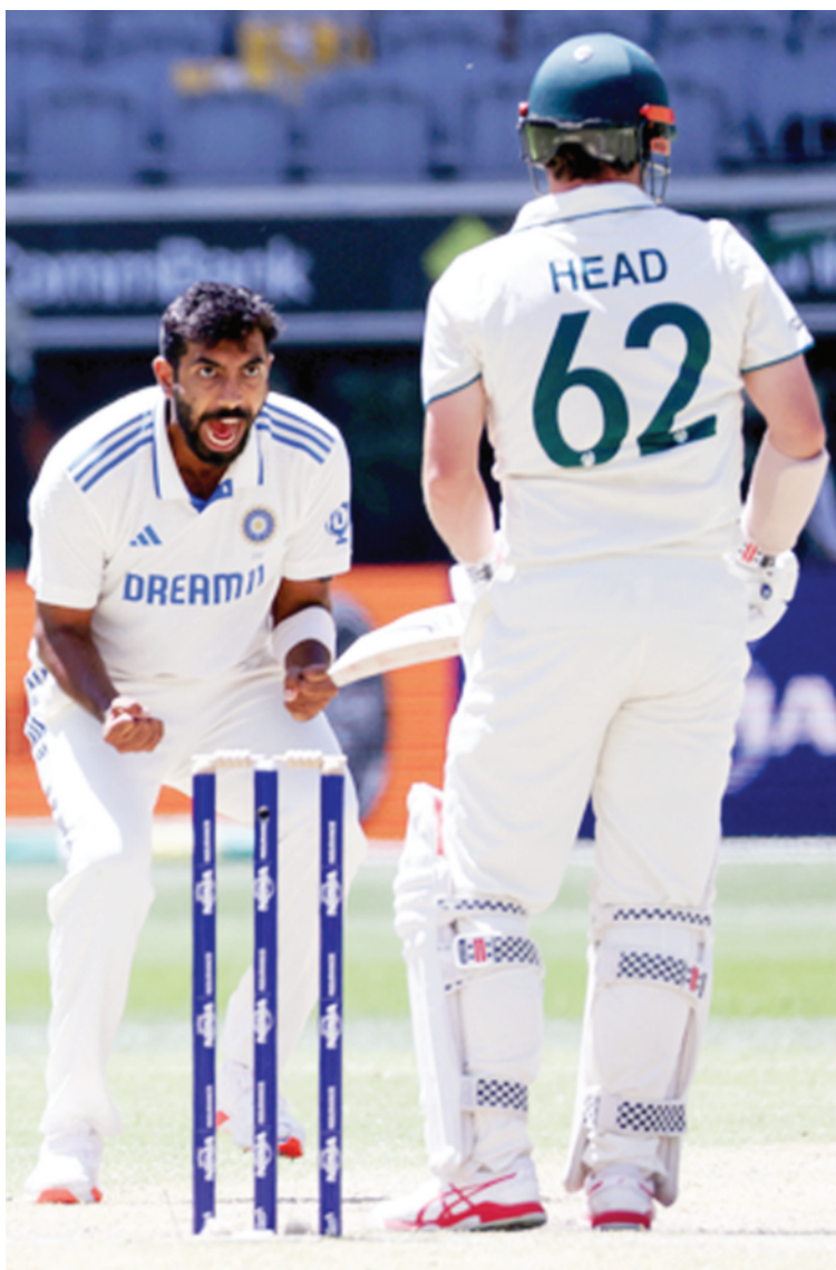
lifted him ten places to 40th.

Head's brilliant 152 at the Gabba, following his century in Adelaide, has moved him up one place to 825 points. Steve Smith's century in the third Test also boosted his ranking, bringing him back into the top ten. On the Indian side, KL Rahul's resilient first-innings performance