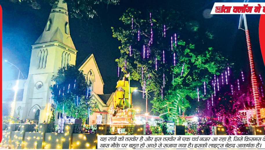
यह रात्री को तस्वीर है और इस तस्वीर में एक चर्च नजर आ रहा है, जिसे क्रिसमस के खास मौके पर बहुत ही अच्छे से सजाया गया है। इसकी लाइट्स बेहत आकर्षक हैं।