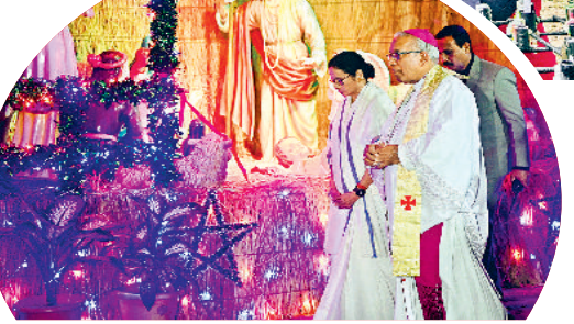
नई दिल्ली। बुधवार को नई दिल्ली स्थित सेंट्रल हार्ट कैथेड्रल में क्रिसमस समारोह के दौरान ईसाई श्रद्धालु।