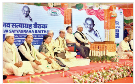
गांधीवादी संस्थाओं पर हमले हो रहे: सोनिया ने मेजा संदेश बैठक में शामिल न होने पर सोनिया गांधी ने कांग्रेस कार्यसमिति को संदेश भेजा है। कांग्रेस ने एक्स पर सोनिया का संदेश साझा किया है। गांधी ने लिखा कि देश भर में विभिन्न स्थानों पर गांधीवादी संस्थाओं पर हमले हो रहे हैं। इसलिए, यह भी उचित है कि इस बैठक को नव सत्याग्रह बैठक कहा जाए।

एक साल तक राजनीतिक अभियान चलाया जाएगा 2025 में संगठनात्मक सुधार के कार्यक्रम चलाए जाएंगे