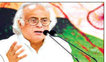
कर्नाटक के बेलगावी में सीडब्ल्यूसी बैठक में लिया फैसला

एजेसी ►► बेलगावी कांग्रेस 26 जनवरी से 'संविधान बचाओ राष्ट्रीय पद यात्रा' शुरू करेगी। कर्नाटक के बेलगावी में गुरुवार को कांग्रेस कार्य समिति (सीडब्ल्यूसी) की बैठक के बाद कांग्रेस के प्रवक्ता जयराम रमेश और कांग्रेस महासचिव के.सी. वेणुगोपाल ने प्रेस कॉन्फ्रेंस कर यह जानकारी दी। कर्नाटक के बेलगावी में गुरुवार को कांग्रेस कार्य समिति (सीडब्ल्यूसी) की बैठक शुरू हुई, जिसे 'नव सत्याग्रह बैठक' नाम दिया गया है। इस बैठक में कांग्रेस पार्टी महात्मा गांधी की अध्यक्षता में हुए बेलगावी अधिवेशन की 100वीं वर्षगांठ मना रही है। सीडब्ल्यूसी बैठक में 2025 में राजनीतिक और चुनावी चुनौतियों के लिए योजना पर मंथन किया गया। कांग्रेस के राष्ट्रीय