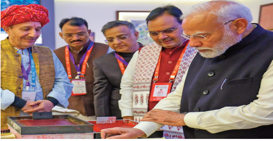
हुई तीन दिवसीय समिट के तहत आयोजित हुई प्रदर्शनी में बतौर मुख्य अतिथि पहुंचे प्रधानमंत्री नरेन्द्र मोदी ने

जयपुर। प्रधानमंत्री श्री नरेन्द्र मोदी की विकासित भारत बनाने की मंशाओं को सार्थक करने के उद्देश्य से मुख्यमंत्री भजनलाल शर्मा की पहल पर सोमवार से जयपुर में प्रारंभ हुए राइजिंग राजस्थान इन्वेस्टमेंट समिट ने निवेशकों के निवेश के अलावा भी राजस्थान को भावी विकास की बहुत सी सौगातें भी दीं। विश्व के 32 देशों के प्रतिनिधियों के साथ ही देशभर के निवेशकों ने जहां 35 लाख करोड़ के निवेश की राह प्रशस्त की वहीं राजस्थान की परंपरागत कलाओं और लघु उद्योगों के प्रति भी विश्व भर का ध्यान आकृष्ट किया। सोमवार से शुरू