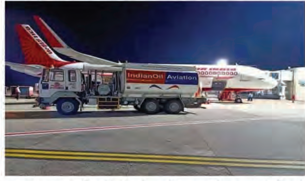
95,231.49 रुपये प्रति किलो लीटर हो गई है, जबकि कोलकाता में एविएशन टरबाइन प्यूल कीमत

एजेंसी नई दिल्ली। सार्वजनिक क्षेत्र की ऑयल मार्केटिंग कंपनियों ने एयर टरबाइन प्यूल एटीएफ यानी जेट प्यूल की कीमत में बढ़ोतरी कर दी है। जेट प्यूल की कीमत में लगातार दूसरे महीने बढ़ोतरी की गई है। आज जेट प्यूल की कीमत में 1.45 प्रतिशत का इजाफा किया गया है। कीमत में की गई इस बढ़ोतरी के बाद दिल्ली में जेट प्यूल की कीमत में 1,318.12 रुपये प्रति किलो लीटर की बढ़ोतरी हो गई है। अब दिल्ली में जेट प्यूल 91,856.84 रुपये प्रति किलो लीटर के भाव पर मिल रहा है। आज की बढ़ोतरी के बाद मुंबई में एविएशन टरबाइन प्यूल की कीमत 84,642.91 रुपये से बढ़ कर 85,861.02 रुपये प्रति किलो लीटर हो गई है। इसी तरह चेन्नई में इसकी कीमत बढ़ कर 94,551.63 रुपये प्रति किलो लीटर के भाव पर मिल रहा है।