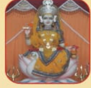
॥ શ્રી ગાયત્રી માતાજી ॥