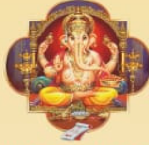
॥ શ્રી ગણેશાય નમઃ ॥