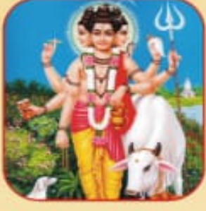
॥ શ્રી ગુરુ દત્તાત્રેયજી ॥