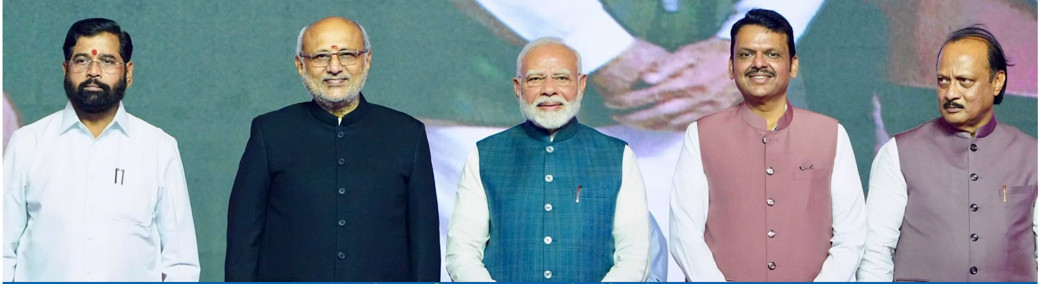
મહારાષ્ટ્રનાં રાજકીય મહાનાટકમાં અંતે સૌ સારા વાના

માલિક/એડિટર : રાજેશ ઉદયકુમાર બગડાઈ | Date : 6 DECEMBER 2024 | FRIDAY | Page : 8 | Year : 2 | Issue : 209 | Price: 2/-