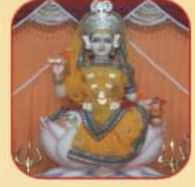
॥ શ્રી ગાયત્રી માતાજી ॥