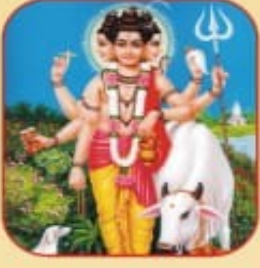
॥ શ્રી ગુરુ દત્તાત્રેયજી ॥