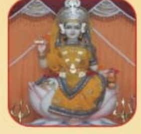
॥ શ્રી ગાયત્રી માતાજી ॥