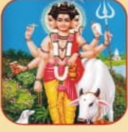
॥ શ્રી ગુરુ દત્તાત્રેયજી ॥