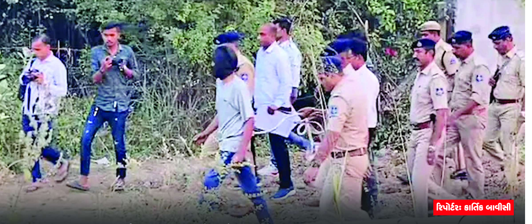
રિપોર્ટર: કાર્તિક બાવીરી