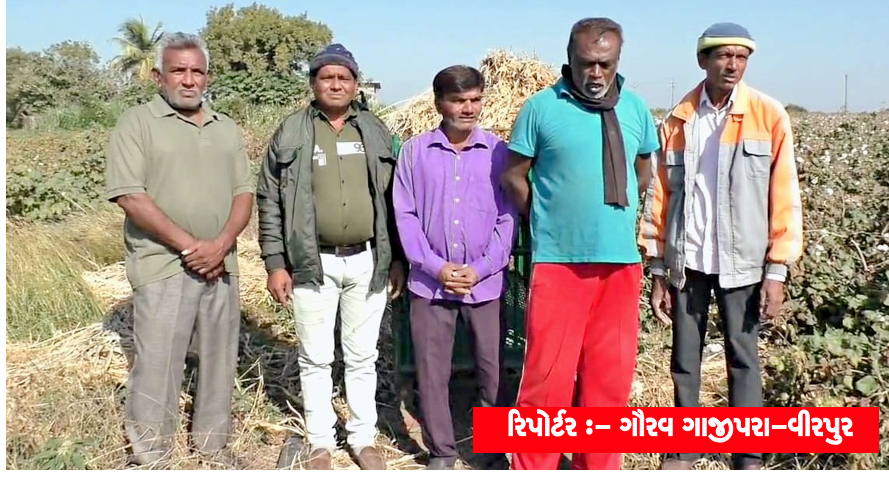
રિપોર્ટર :- ગૌરવ ગાજીપરા-વીરપુર

વિરપુર, તા. ૧૧: સૌરાષ્ટ્રમાં ખેડૂતો સ્વીપાકની સીઝનમાં ઘઉં, ચણા, ધાણા સહિતના અનેક પાકોના વાવેતર કરી રહ્યા છે અને વાવેતર કરેલા પાકોમાં ખેડૂતોને પિયત, જંતુનાશક દવાઓના છટકાવની કામગીરી કરવાની હોય છે, સાથે કામગીરી માટે મજૂર ને પણ જરૂરિયાત પડતી હોય છે પરંતુ દીપડા જોવા મળતા ખેત મજૂરો મજૂરી કામ માટે આવી રહ્યા નથી, સાથે વાડી વિસ્તારમાં કામગીરી કરતા કરતા સુર્યાસ્ત એટલે કે સાંજ પણ પડી જતી