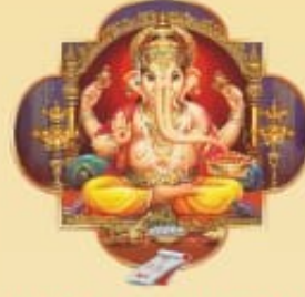
॥ શ્રી ગણેશાય નમઃ ॥