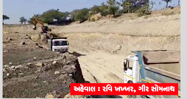
અહેવાલ : રવિ ખખર, ગીર સોમનાથ

બઝલા ગામે આવેલ સરકાર તળાવમાંથી ડિસેમ્બરથી માર્ચ સુધી બેફામ રીતે હજારો મેટ્રિક ટન માટીચોરીને અંજામ આપવામાં આવ્યો હતો.