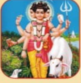
॥ શ્રી ગુરુ દત્તાત્રેયજી ॥