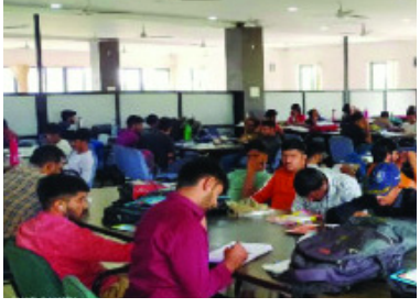
રાજકોટ, તા. ૧૬

એક મહિનામાં પુસ્તકાલયોની મુલાકાત લેતા ૩૯ હજાર લોકો: પુસ્તકોની ખરીદી ચાલુ