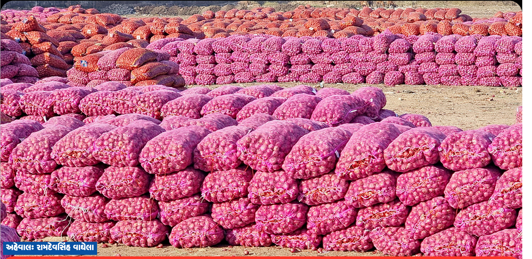
અહેવાલ: રામદેવસિંહ વાઘેલા