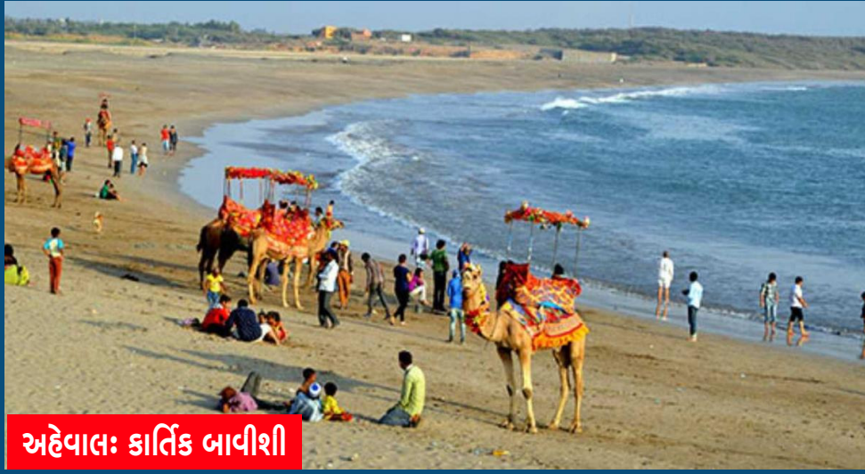
અહેવાલ: કાર્તિક બાવીશી

સુરત: ગુજરાતીઓ બીચની મજા માણવા માટે ગોવા કે દીવ જવાનું પસંદ કરતા હોય છે. જો કે, હવે બીચની મજા માણવા માટે ગુજરાતમાં જ એક નવું સ્પોટ આકાર લઈ રહ્યું છે. સુરતના સુવાલી બીચને વર્લ્ડ ક્લાસ બીચ બનાવવા માટે વિકાસ કામનો પ્રારંભ કરી દેવામાં આવ્યો છે. લોકો બીચથી રૂબરૂ થાય તે માટે રાજ્ય સરકાર દ્વારા સતત બીજા વર્ષે બીચ ફેસ્ટિવલનું આયોજન કર્યું છે. આજથી શરૂ થઈ રહેલા ત્રિદિવસીય બીચ ફેસ્ટિવલમાં લોકો માટે અહીં ખાણીપીણીની સાથે ભરપૂર મનોરંજન માણી શકશે. કિંજલ દવે, ગોપાલ સાધુ જેવા કલાકારો પ્રવાસીઓને ડોલાવશે. સુરતના સુવાલી બીચ પર રાજ્ય સરકાર દ્વારા સતત બીજા વર્ષે સુવાલી બીચ ફેસ્ટિવલનું આયોજન કરાયું છે. જેનું આજે કેન્દ્રીય મંત્રી સીઆર પાટીલના હસ્તે ઉદઘાટન કરવામાં આવશે. બીચ ફેસ્ટિવલમાં આજે પ્રથમ દિવસે રાત્રે લોકગાયિકા કિંજલ દવેનો કાર્યક્રમ યોજાશે. ૨૧મી તારીખે ગોપાલ સાધુનો લોક ડાયરો અને ૨૨મી તારીખે સ્થાનિક કલાકારો તરફથી ગઝલ સંઘ્યા અને ટેરીફિક બેન્ડના લાઈવ શોનું આયોજન કરાયું છે. આ ઉપરાંત ફેસ્ટિવલની મજા માણવા આવનારા પ્રવાસીઓ ઊંટ અને ઘોડેસવારી, કુડ કોર્ટ, કાફ્ટ સ્ટોલ,