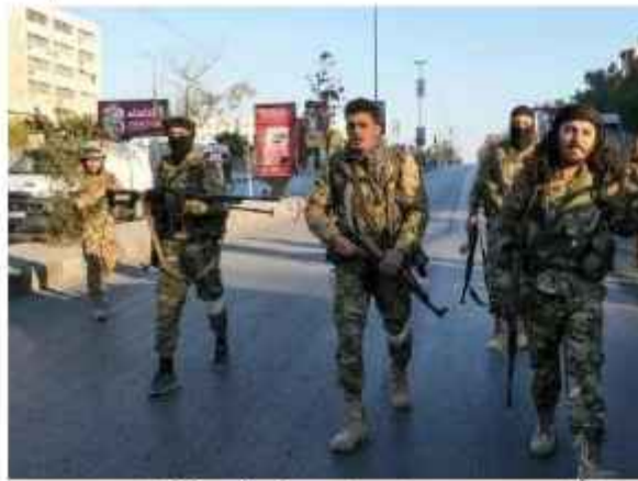
شام میں کشیدگی روکنے کی ضرورت پر زور دیا گیا۔ امریکی وزیر خارجہ انتھونی بلینکن نے اتوار کے روز اپنے ترک ہم منصب کاہن کاوان کی وزارت خارجہ کے بیان کے مطابق بلینکن نے

شام میں جارحیت کے روکے جانے اور شہریوں اور بنیادی ڈھانچے کی حفاظت کرنے پر زور دیا۔ شام میں انسانی حقوق کی رصدگاہ المرصد نے اتوار کے روز بتایا تھا کہ ترکی کی حمایت یافتہ مسلح گروپ شمالی حلب میں واقع متعدد شہروں اور دیہات پر کنٹرول حاصل کرنے میں کامیاب ہو گئے ہیں۔ المرصد کے مطابق حملہ رقت، ہنغ، مرخانہ، کفرنا، الیخیمی اور ہمال اور