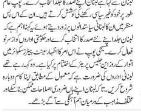
بیروت، 02 دسمبر (ایجنسی)۔ پوپ فرانسس نے زور دے کر

لبنان سے کہا ہے لبنان اپنے صدر کا جلد انتخاب کرے۔ پوپ عام طور پر خود کو غیر سیاسی رکھنے کی کوشش کرتے ہیں۔ ان کے اس پاس منظر میں ان کا لبنانی سیاست دانوں پر زور دینے ہوئے یہ کہنا ہم سے کہ لبنان جلد اپنے نئے صدر کا انتخاب کرے اور ملوثی اداروں کو از سر نو فعال کرے۔ سچی پوپ نے اس امر کا اظہار سمیت بیئر لیکسٹون میں اتوار کے روز زین طلحس پریس کانفرنس پر کیا ہے۔ وہ کہہ رہے تھے لبنانی اداروں کی ضرورت ہے کہ معمول کے مطابق اپنا کام دوبارہ شروع کریں۔ تا کہ لبنان اپنے پاس ضروری اصلاحات ممکن بناسکے اور مختلف مذاہب کے درمیان ہم آہنگی سے آگے بڑھے۔