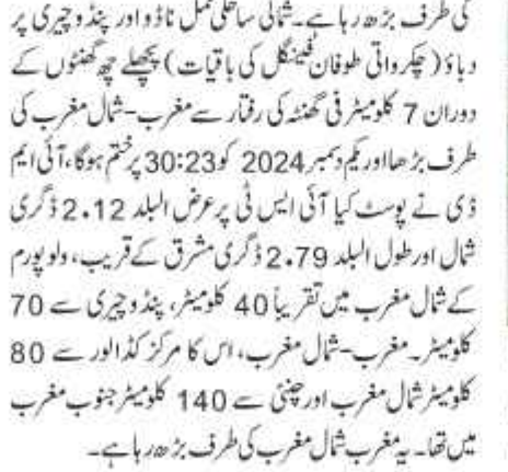
نئی دہلی: بھارتی ملکہ موسمیات (آئی ایم ڈی) نے پیر کو کہا کہ چکر واتی طوفان فیننگل کا کچھ باقی ماندہ ہوا پھیلنے چھٹنوں کے دوران 7 کلو میٹر فی گھنٹہ کی رفتار سے مغرب۔ شمال مغرب میں تھا۔ جبکہ ایک ویڈیو میں ایلا صوبہ کے سینگک ٹو ضلع میں امدادی کارکن

کی طرف بڑھ رہا ہے۔ شمالی ساحلی تمل ناڈو اور پنڈوچری پر دباؤ (چکر واتی طوفان فیننگل کی باقیات) پھیلنے چھٹنوں کے دوران 7 کلو میٹر فی گھنٹہ کی رفتار سے مغرب۔ شمال مغرب کی طرف بڑھ رہا ہے۔ پیر کو 2024 کو 23:30 پر قسم ہوگا، آئی ایم ڈی نے پوسٹ کیا آئی ایس ٹی پر عرض البلد 2.12 ڈگری شمال اور طول البلد 79.27 ڈگری مشرق کے قریب، ولو پورم کے شمال مغرب میں تقریباً 40 کلو میٹر، پنڈوچری سے 70 کلو میٹر مغرب۔ شمال مغرب، اس کا مرکز تمل ناڈو سے 80 کلو میٹر شمال مغرب اور چینی سے 140 کلو میٹر جنوب مغرب میں تھا۔ یہ مغرب شمال مغرب کی طرف بڑھ رہا ہے۔