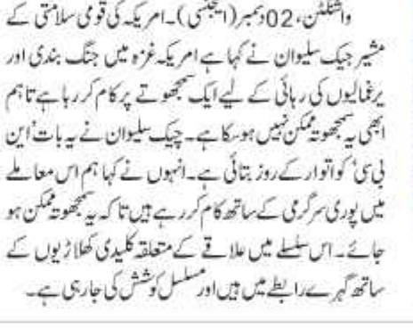
واشنگٹن، 02 دسمبر (ایجنسی)۔ امریکہ کی قومی سلامتی کے

مشیر جیک سلیوان نے کہا ہے امریکہ غزہ میں جنگ بندی اور برقیوں کی رہائی کے لیے ایک سمجھوتہ پر کام کر رہا ہے تاہم ابھی یہ سمجھوتہ ممکن نہیں ہو سکا ہے۔ جیک سلیوان نے یہ بات این پی سی گواٹار کے روز بتائی ہے۔ انہوں نے کہا کہ اس معاملے میں پوری سرگرمی کے ساتھ کام کر رہے ہیں تاکہ یہ سمجھوتہ ممکن ہو جائے۔ اس سلسلے میں علاقے کے مختلف کلیدی کھلاڑیوں کے ساتھ گہرے رابطے میں ہیں اور مسلسل کوشش کی جا رہی ہے۔