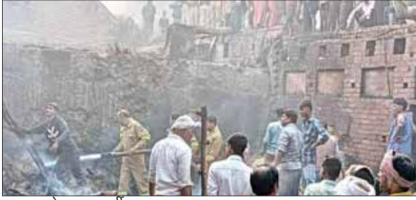
आग बुझाते दमकल कर्मी।