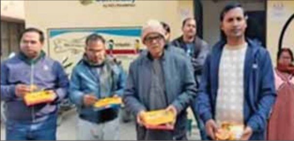
बीआरसी पर हंगामा करते शिक्षक