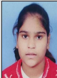
जिया का फाइल फोटो