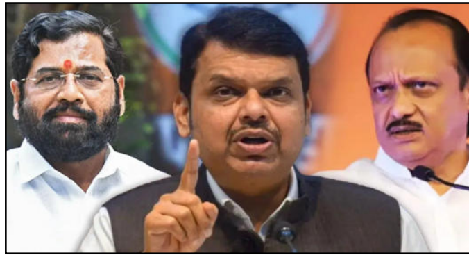
है कि भाजपा से ही कोई मुख्यमंत्री बनना है तो उन्हें कोई दिक्कत नहीं होगी। बता दें कि मुख्यमंत्री के शपथ ग्रहण समारोह के लिए 5 दिसंबर को

मुंबई (आरएनएस)। महाराष्ट्र के मुख्यमंत्री को लेकर चल रहा असमंजस बुधवार को समाप्त हो सकता है। यह निर्णय बुधवार (4 दिसंबर) को विधान भवन में बुलाई गई भाजपा विधायक दल की बैठक में होगा। बैठक में पार्टी के केन्द्रीय पंचवैश्वक केन्द्रीय वित्त मंत्री निर्मला सीतारमण और गुजरात के पूर्व मुख्यमंत्री विजय रूपाणी शामिल रहेंगे। बैठक सुबह 11 बजे शुरू होगी। विधायक दल की बैठक में मुख्यमंत्री के नाम पर अंतिम मुहर लगेगी, जिसकी जानकारी हाईकमान को देने के बाद आधिकारिक घोषणा होगी। विजय रूपाणी ने कहा कि भाजपा सबसे बड़ी पार्टी बनकर उभरी है, ऐसे में लगता