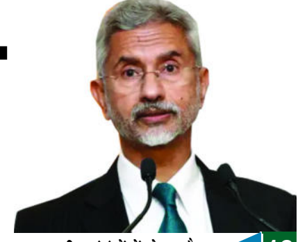
भारत-चीन संबंधों में हो रहा है...