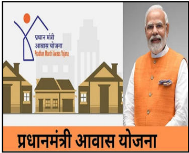
प्रधानमंत्री आवास योजना

नई दिल्ली (आरएनएस)। केन्द्रीय आवास और शहरी मामलों के राज्य मंत्री तोखन साहू ने हाल ही में राज्यसभा में जानकारी दी कि आवास और शहरी मामलों के मंत्रालय (एमओएचयूए) की ओर से इस साल 18 नवंबर तक 1.18 करोड़ से अधिक घरों को मंजूरी दी गई है। केन्द्रीय मंत्री ने कहा कि प्रधानमंत्री आवास योजना (शहरी) के तहत मंत्रालय 25 जून, 2015 से भारत भर के शहरी क्षेत्रों में पक्के मकान उपलब्ध करवाने के उद्देश्य से केन्द्रीय सहायता प्रदान कर रहा है। केन्द्रीय मंत्री ने संसद को जानकारी दी कि प्रधानमंत्री आवास योजना (शहरी) के तहत लाभार्थियों को 88 लाख से अधिक घर वितरित किए गए हैं। एक प्रश्न के लिखित उत्तर में, केन्द्रीय आवास और शहरी मामलों के राज्य मंत्री ने कहा, पीएमएवाई-यू के अंतर्गत राज्य/संघ राज्य क्षेत्र सरकारों द्वारा प्रस्तुत परियोजना प्रस्तावों के आधार पर, 18 नवंबर तक मंत्रालय द्वारा कुल 118.64 लाख मकान स्वीकृत किए गए हैं और 88.02 लाख से अधिक मकान पूरे हो