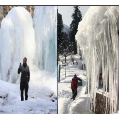
बार ला नीना के वापस आने से अच्छी बर्फबारी के साथ कड़ाके की सर्दी का अनुमान है, जिससे पर्वतों की आमद बढ़ सकती है। बर्फबारी से स्थानीय लोगों

3 बार हल्की बर्फबारी हो चुकी है। इससे पहले बर्फबारी के कारण तापमान में गिरावट दिख रही है और रात का तापमान लगातार शून्य डिग्री सेल्सियस और माइनस 5 डिग्री सेल्सियस के बीच है। जम्मू-कश्मीर, लद्दाख में सामान्य से अधिक वर्षा होने से अधिक ठंड की संभावना है। पिछले साल अल नीनो के कारण क्षेत्र में वर्षा कम हुई थी और तापमान में भी वृद्धि दर्ज की गई थी, जिससे मौसम विशेषज्ञ काफी चिंतित थे। पिछले कुछ वर्षों से जम्मू-कश्मीर अत्यधिक मौसम परिवर्तनों से जूझा है। इस