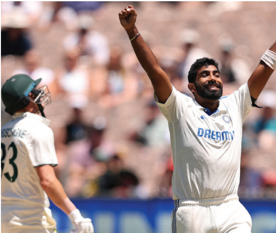
सिराज ने स्टीव स्मिथ को अपना शिकार बनाया। वह 13 रन बना

भारत और ऑस्ट्रेलिया के बीच बॉर्डर गार्डस्कोर टॉफी के तहत खेला जा रही पांच मैचों की टेस्ट सीरीज के चौथे मैच के चौथे दिन का खेल खत्म हो गया है। ऑस्ट्रेलिया टीम ने अपनी दूसरी पारी में 9 विकेट खोकर 228 रन बना लिए हैं। नाथन लियोन 41 रन और स्कॉट बोलेड और 10 बनाकर नाबाद हैं। दोनों ने आखिरी विकेट के लिए अब तक 55 रन की साझेदारी कर ली है। मेजबान टीम ने अपनी पहली पारी में 474 रन बनाए थे। इसके बाद भारतीय टीम ने अपनी पहली पारी में 369 रन बनाए। इससे पहली पारी के आधार पर ऑस्ट्रेलिया के पास 105 रन की बढ़त थी। ऐसे में अब उसकी कुल बढ़त 333 रन की हो चुकी है। ऑस्ट्रेलिया टीम की दूसरी पारी की शुरुआत अच्छी नहीं रही और 20 रन के स्कोर पर पहला झटका लगा। सलामी युवा बल्लेबाज सैम कॉस्टास को जसप्रीत बुमराह ने पवेलियन भेजा। कॉस्टास ने 8 रन बनाए। इसके बाद मोहम्मद सिराज ने उस्मान ख्वाजा को आउट कर दिया। ख्वाजा ने 21 रन बनाए। फिर