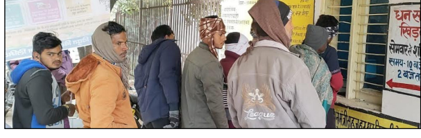
शकुन टाइम्स संवाददाता

कन्नौज। उत्तर प्रदेश सरकार की योगी सरकार बिजली बिल बकाये दार उपभोक्ताओं की सहूलियत के लिए एक मुस्त समाधान योजना लागू की। जिससे उपभोक्ताओं को बिल जमा करने में कोई परेशानी न हो। कई लोगों ने बिल जमा कर दिया है। लेकिन बिजली विभाग के अधिकारियों ने कनेक्शन की जगह 37 गाँव की बिजली काट दी। अडियल रैवया से 37 गाँव की बिजली ठप्प है। जिससे ग्रामीणों को भारी दिक्कत हो रही है 72घंटों के बाद भी बिजली अपूर्ति चोल् नहीं की। बिजली अपूर्ति न करने से सर्द रात्रि में कोई अनहोनी की आशंका बनी हुई है। ठठिया करे डा पटी