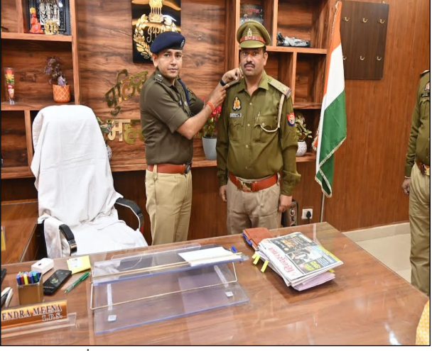
शकुन टाइम्स संवाददाता