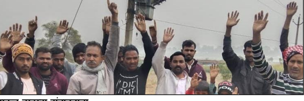
शकुन टाइम्स संवाददाता