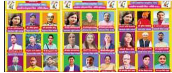
लोकतंत्र की आवाज