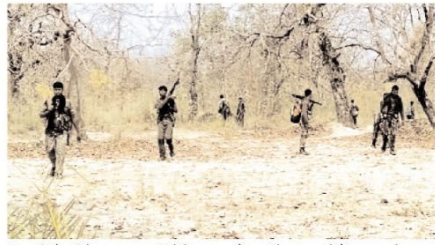
कि इनकी चौकीसी के बावजूद नक्सलियों के पास अत्याधुनिक हथियार और विस्फोटक किताब तरह और कहां से पहुंच पा रहे हैं। इस बात से इनकार नहीं किया जा सकता कि छत्तीसगढ़ के बीजापुर

देखे जाते हैं। छत्तीसगढ़ के बीनापुर में हुआ ताजा नक्सली हमला इसी का एक उदाहरण है। बाबूया जा रहा है कि उदरगढ़ में पहले सुरक्षाबलों के अभियान के जवाब में नक्सलियों ने यह हमला किया। जब दंतवाड़ा, नारायणपुर और बीजापुर को संयुक्त दल तलाशी अभियान से बचास लेते रहे, तब बाद लगाकर घेरे नक्सलियों ने उनके वाहन पर हमला कर दिया। इसमें आठ सुरक्षाकर्मी और एक वाहन चालक मारे गए। इस हमले में आईडी विस्फोटक का इस्तेमाल किया गया। इसकी शक्ति आम विस्फोटकों से कई गुना अधिक होती है। सरकार अक्सर दवा करती है कि नक्सलियों का लक्ष्य समाजवाद कर दिया गया है और अब वे कुछ सीमित इलाकों तक सिमट कर रह गए हैं। मगर यह समझना मुश्किल है