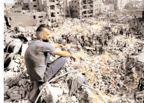
है। इतने व्यापक विनाश, क्रूरता, हिंसा की संसार अनेकजै कैले कर रहा है, यह प्रश्न मानव के अस्तित्व एवं अस्मिता से जुड़ा होकर भी इतना सून कैसे है?

आतंकवाद अमेरिका में हुए इस आतंकी हमले की नहीं है। समूची दुनिया युद्ध और शांति, आतंक एवं अमान्द, हिंसा और अहिंसा, भय और अमय के बीच झुलस रही है। दुनिया में कई सनात युद्धत हो गए। जबकि ज्यादातर लोग शांति चाहते हैं। अनेक अंतर्विरोध युद्ध विरोधाभास देने को मित रह जाते हैं। शांति का मतलब यतक युद्ध का अभाव नहीं होता, बल्कि एक ऐसा वातावरण होता है जहां गतिशील, मजबूत, सौहार्दपूर्ण और संयुक्त समाज का निर्माण होता है। ऐसे समाजों में मानव धन का अधिकाधिक इस्तेमाल होता है और जिनमें शांति एवं सहजीवन के रूप में व्यतीत होता है।